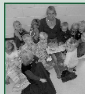
Humpy Dumpy doet mee aan nationale ontbijtdag. Pagina 21