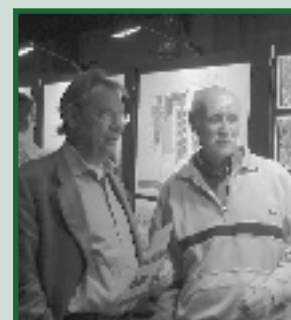
Bouwplannen en verkeersproblemen pagina 19