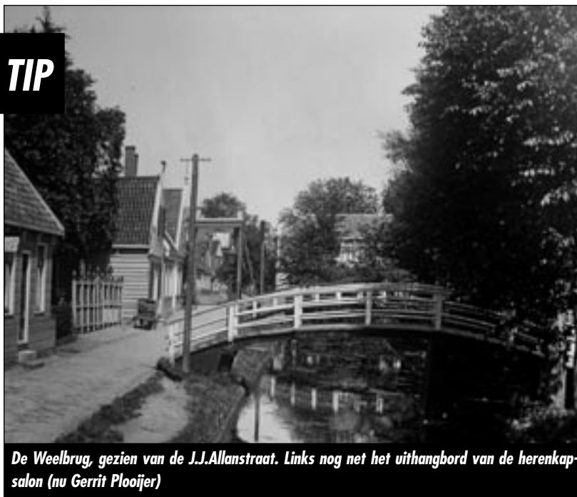
De Weelbrug, gezien van de J.J.Allanstraat. Links nog net het uithangbord van de herenkap-salon (nu Gerrit Plooijer)

Landelijk duurt de vrije walvisvaart ruim een eeuw. Na 1766 stort ze goeddeels in. De Zaanse walvisjacht blijft veel langer in stand, tot zelfs na de Vierde Engelse zeeoorlog (1784). Het hoogtepunt van de Zaanse walvisvaart ligt echter aan het eind van de Gouden Eeuw. Elk jaar varen dan omstreeks zeventig schepen naar het noorden. Dat is meer dan het aantal Zaanse schepen dat in de hoogtijjaren naar de Oostzee vertrok. Na 1700 daalt het aantal walvisvaarders heel geleidelijk.