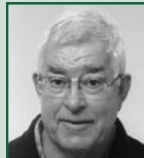
Fa. Hos in Adverteerder v/d maand pagina 5