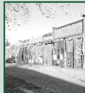
Nieuwbouwproject Avis pagina 5