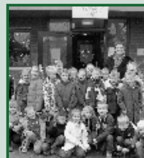
Groep 3 en 4 van Kroosduiker-Zuid pagina 15