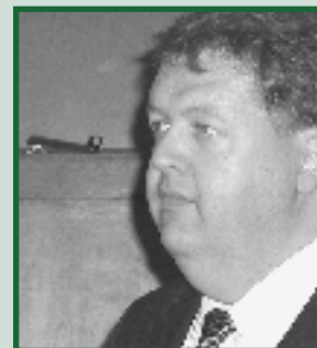
Bezoek burgemeester Meijdam Pagina 11