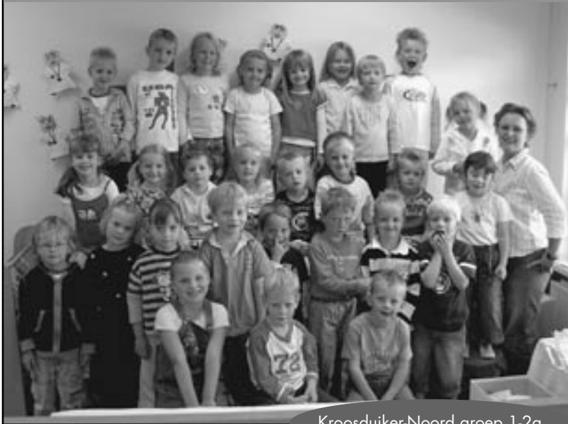
Kroosduiker-Noord groep 1-2a