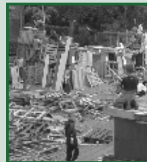
Huttenbouw Westzaan Pagina 17