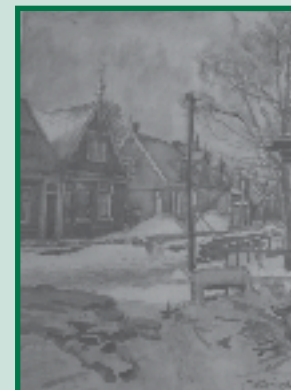
De Jansen cyclus moet u deze maand missen. Volgende maand weer een episode uit het leven van de Westzaanse kunstenaars.