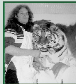
Corvis zijn expositie 'Met Huid & Haar'. Pagina 17