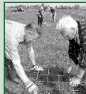
De stokkenzettersploeg aan het werk. Pagina 5