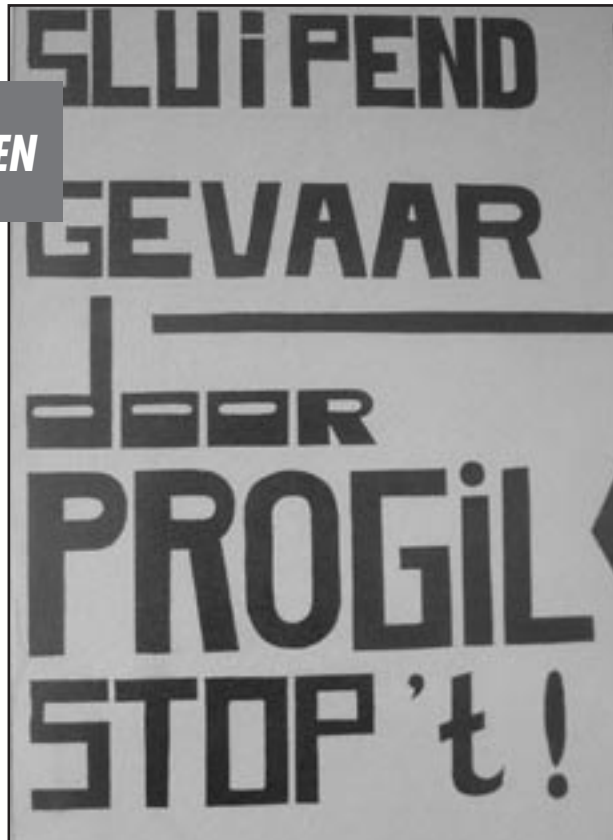
Poster die in mening huiskamer aan de muur hing, te koop voor één gulden