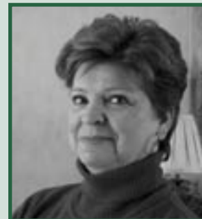
An Spijker in De Schijnwerper Pagina 7