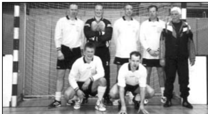
De winnaar: Westzaan

De uitlag: 1: Westzaan, 2: Kring 3, 3: Krommenie, 4: Kring 7, 5: Assendelft, 6: Zanddijk, 7: Jeugdbrandweer, 8: Koog aan de Zaan.