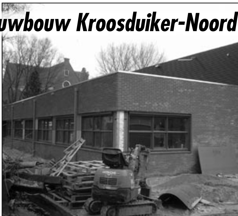
Het nieuwe schoolgebouw is al bijna klaar...

Anneke Vlot vertelt: "We zijn zelf - in de weekeinden - al bezig met het schilderen van kasten en banken. Je wilt toch dat je nieuwe gebouw er leuk uit ziet. Veel kasten in het oude gebouw