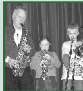
Crescendo onder druk? Pagina 3