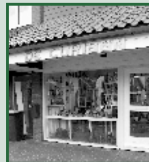
Curiosa in De Curiaan Pagina 5