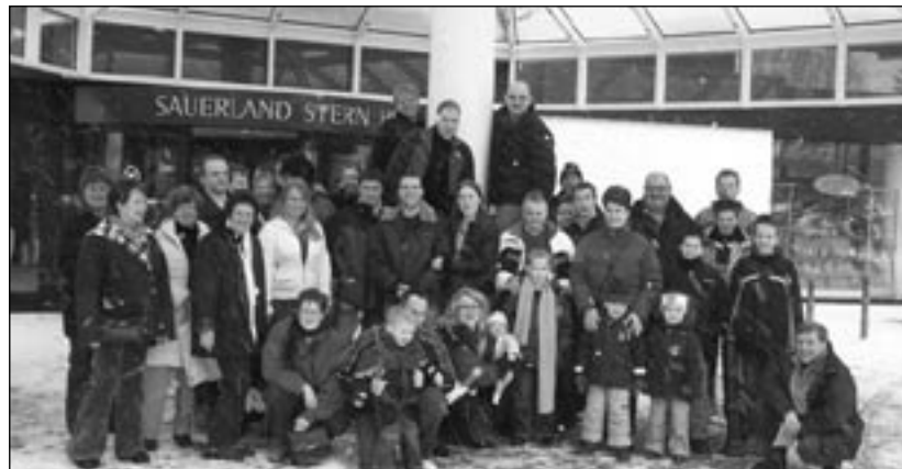
De hele groep Westzaners in de sneeuw