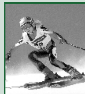
Topper in dop op lange latten Pagina 8