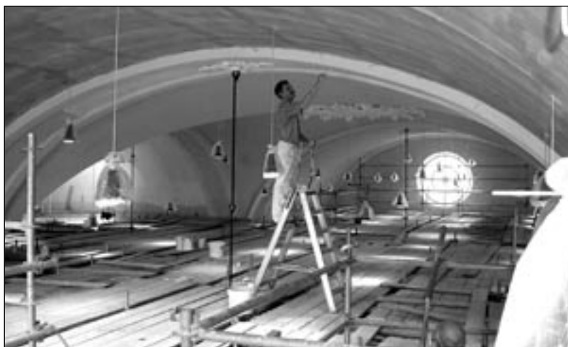
Frits Klerk op 14 meter hoogte aan het werk

In 1999 en 2000 werd begonnen aan de renovatie van de kap. Dit was noodzakelijk omdat zich onder de dakpannen een teerlaag bevond, die bij doorregenen van de dakpannen, een stof afscheidde die de koperen goten