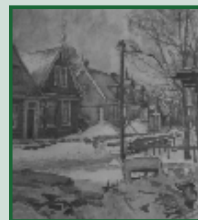
Willem Jansen Cyclus Pagina 5

85-jarig jubileum van de vrijwillige brandweer Westzaan pagina 9