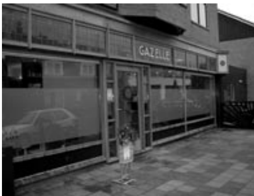
De fraaie gevel van Zonnesalon Surya.

Iedereen die de laatste weken ons dorp binnen rijdt zal het hebben gezien. De dominant aanwezige witte voorzetgevel heeft weer plaatsgemaakt voor de fraaie houten gevel van de voormalige Gazellewinkel.