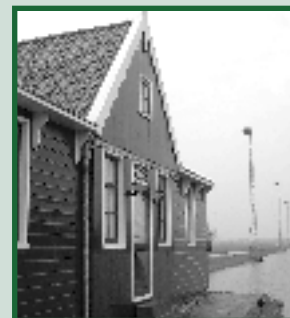
Krijgen we nog ijs deze winter? pagina 21