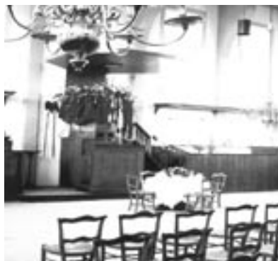
Het interieur met zicht op de preekstoel

Door afspraken met een gerenommeerd cateringbedrijf is het ook mogelijk om de complete receptie en diner te laten verzorgen. Daarmee biedt de Zuidervermaning een complete oplossing. Niet alleen voor trouwerijen. Ook voor bedrijfspresentaties, jubilea, concerten en toneeluitvoeringen is de locatie zeer bijzonder. Het gebouw leent zich goed voor het opstellen van audiovisuele apparatuur en presentatiewanden. Facilitair zijn de zaken goed voor elkaar. Er zijn moderne toiletten en een goede keuken. De kerkeradskamer is zeer geschikt als kamer voor voorbereidingen.