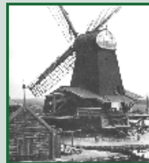
Laatste deel 4-luik Willem Tip pagina 15