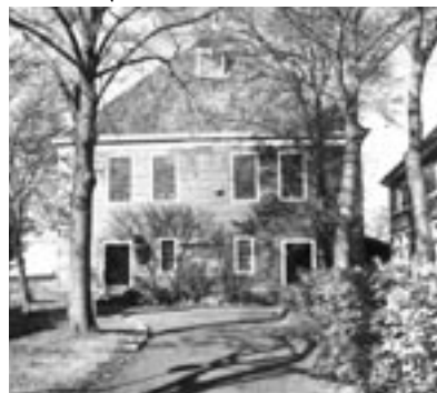
Een statige toegang met daarachter de Vermaning