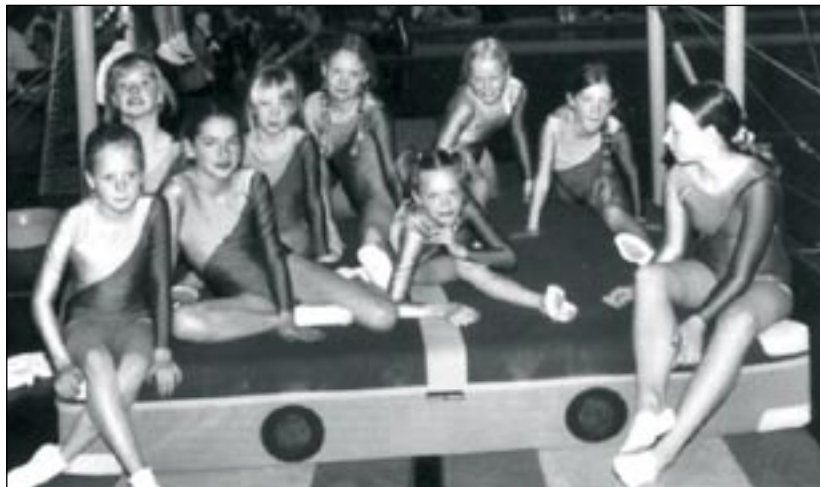
Negen jonge turnsters die deel uitmaakten van de meisjescompetitie

De recreanten, zoals de groep kinderen van 6 tot 12 wordt genoemd, houden zich bezig met turnactiviteiten. Er is een forse meisjesgroep. Maar de 18-koppige jongensgroep mag er ook zeker zijn. "We hebben ontzettend leuke, enthousiaste groepen. Je richt je bij die jongens vooral op kracht. Veel rekstok en ringen dus. Met de meiden trainen we meer op souplesse en evenwicht. We werken met deze groepen volgens een leerplan van de gymnastiekbond. Zo kunnen we ze steeds een nieuwe uitdaging bieden. En telkens als ze een deelvaardigheid onder de knie hebben, krijgen ze een Gymmie. Dat is een soort flippo, maar dan mooier. Die kunnen ze weer sparen en dat motiveert de