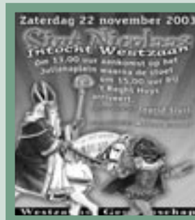
Sinterklaas komt er weer aan! Pagina 3