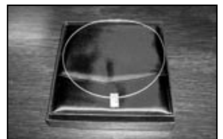
Het cadeau, een fraaie ketting