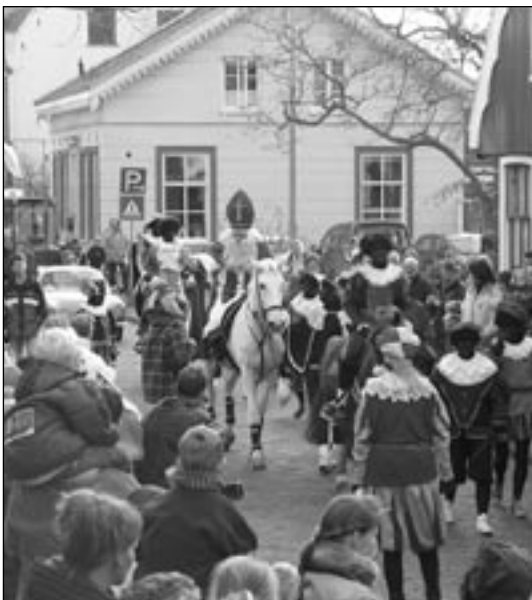
De intocht van vorig jaar leverde een drukte van belang op in Westzaan