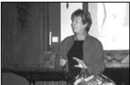
"Bedankt, dit had ik niet verwacht"