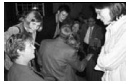
"Ik ben er een beetje stil van"