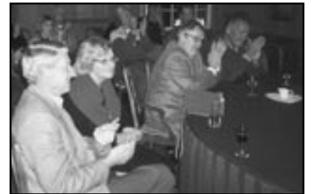
Een goed gevulde raadszaal