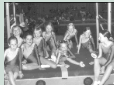
Jahn viert 120-jarig jubileum Pagina 5