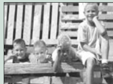
Warmte slaat toe bij huttenbouw. Pagina 8