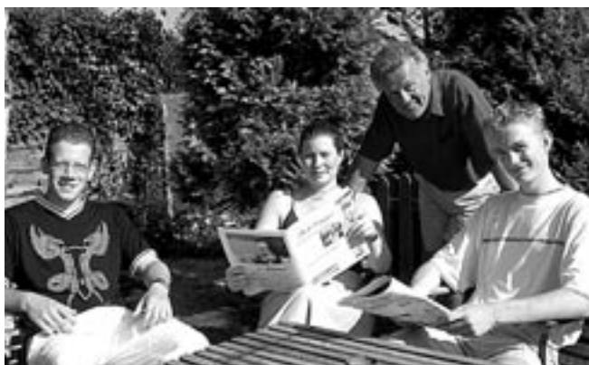
Het enthousiaste vormgeverteam is er helemaal klaar voor.

Het laatste halfjaar is intensief nagedacht en gesproken over hoe de Wessaner in de toekomst moet worden vormgegeven. Na de bestudering van meerdere opties is uiteindelijk de beslissing genomen om een team van meerdere mensen te formeren die met elkaar de formule en kwaliteit bewa-