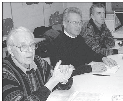
Stembureau De Kwaker.

tellen van alle (voorkeur-) stemmen is verleden tijd. Een druk op de knop maakt duidelijk wat de Westzaners