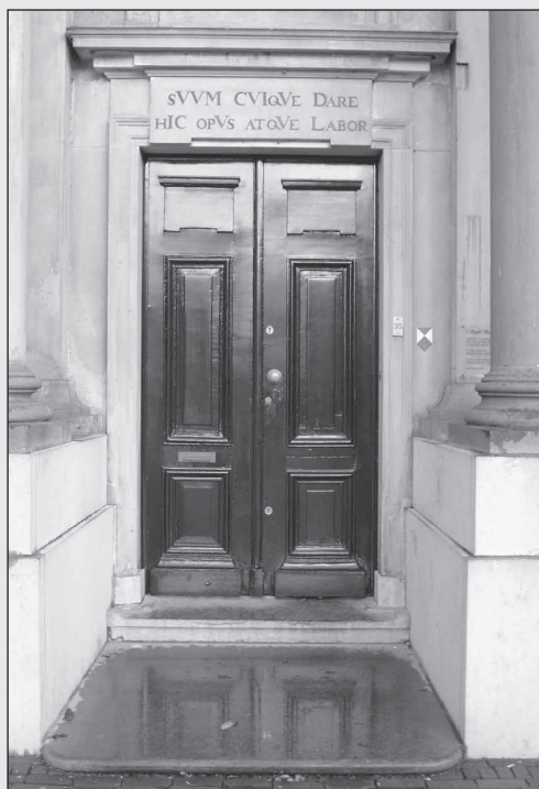
De oude deuren van het Reght Huys.

Timmerfabriek Visser uit Zaandam maakt de nieuwe deuren en aannemer Kuyt uit Westzaan hangt ze af. De deuren zijn nog niet in productie, maar nu het financiële plaatje rond is, kan dat spoedig gebeuren. Op de totale kosten van € 7.000,- ontvangt Stichting 't Regt Huys een subsidie van het Schipholfonds van € 2.500,-. De oude deuren gaan voornamelijk naar de sloop, maar misschien weet iemand in het dorp hier nog een bestemming voor. Naast de nieuwe deuren komen er op het dak haken waar de ladder aan