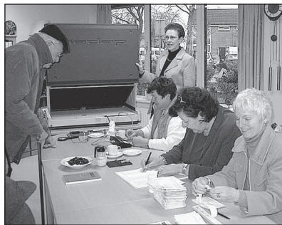
Stembureau Lambert Melisz.

Ten opzichte van vroeger is het de laatste jaren door de stemmachine makkelijker geworden. Het eindeloos