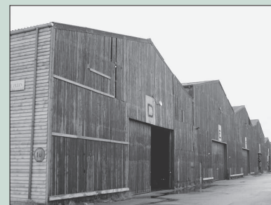
Loodsen maken plaats voor woningbouw, pagina 1 en 2.