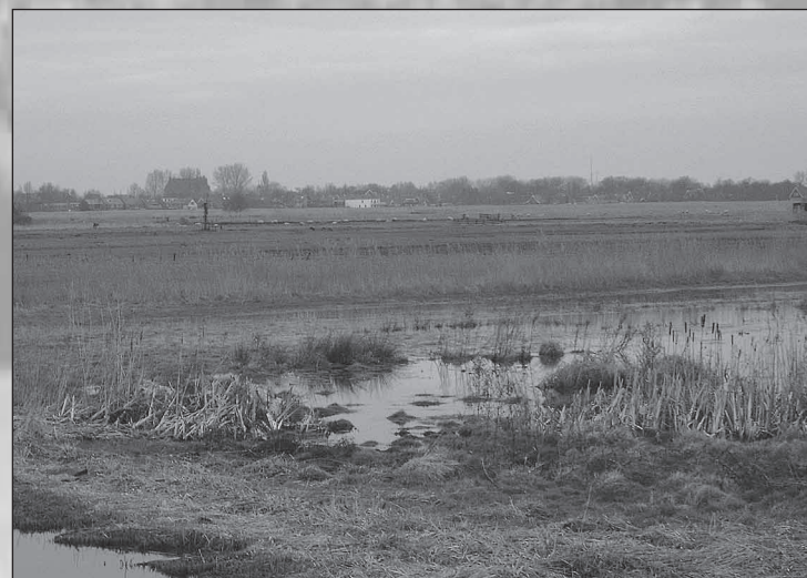
foto rechts boven: de Middel midden: molen Het Prinsenhof onder links: het Guisveld onder rechts: de Reef