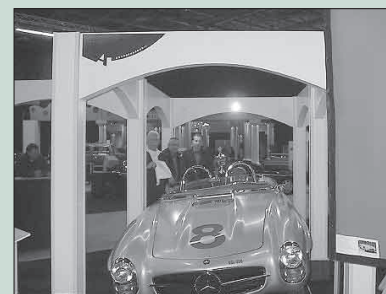
Best car of the show, pagina 10.