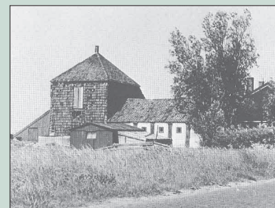
Boerderij in de Middel. Veel bedrijven zijn verdwenen, pagina 6.