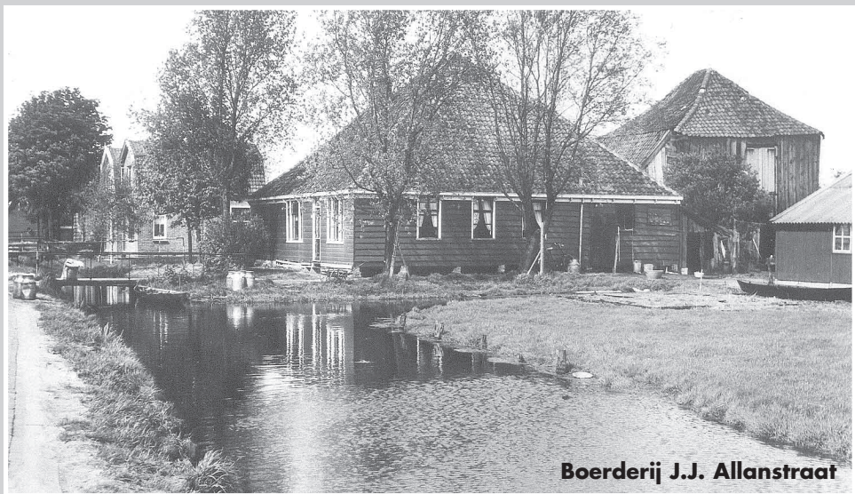
Boerderij J.J. Allanstraat

De met ● aangeduide zijn bedrijven waar nog gemolken wordt. De met ❖ aangeduide zijn bedrijven met nog mestvee.