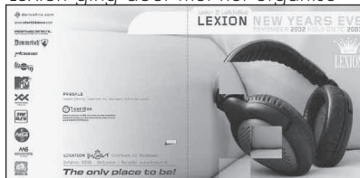
Flyer voor de nieuwjaarsavond.