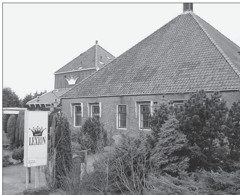
Lexion weer in volle glorie.

Sinds november is Lexion geopend op zondag van vijf uur 's middags tot half twee 's nachts. Men kan terecht in de Kleine Arena, de Decozaal en de Verborgene Tempel,