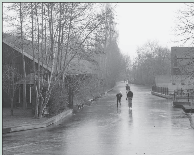
Schaatsen op zaagselvrije Dijksloot.

De laatste keer dat we echt konden genieten van ijs op de sloten van ons dorp dateert alweer van 1997. Door de kwakkelwinters van de afgelopen jaren waren we het al bijna vergeten, maar het kan nog steeds vriezen in ons kikkerdorp. Zo ook halverwege december en dus konden de talloze liefhebbers van ijspret in de laatste maand van 2002 toch nog hun schaatsen van zolder halen. Helaas ging de matige vorst gepaard met een harde wind, waardoor de ijskwaliteit op veel plaatsen te wensen overliet. Overal bevonden zich dan ook enorme windwakken die later, toen de wind was gaan liggen, bedekt werden met een dun ijsvliesje. Gevaarlijk omdat je het verschil tussen dik en dun ijs niet meer kon zien. Menig schaatser moest zijn enthousiasme dan ook met een nat pak bekopen. Het mocht de pret niet drukken. Jong en oud zwierven over de sloten en voor de kinderen was het schoolplein in een ijsbaan omgetoverd. Ijsbaan Lambert Melisz opende al snel en alle scholen lasten een ochtend of middag ijspret in. Zelfs het 'beroemde' rondje om Westzaan was mogelijk en het ijs op deze route was van uitstekende kwaliteit, zelfs onder alle bruggen door kon worden geschaatst. Na een paar dagen vorst waarde zelfs het E-woord door ons land. Net toen het serieus werd, zette de dooi in. Wie weet komt er deze of volgende maand toch nog een Elfstedentocht. Het ijsplezier van december 2002 werd in beeld gebracht door Koert Klerk.