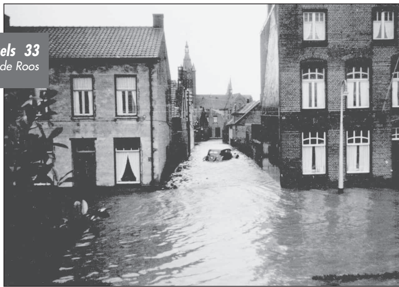
Februari 1953: Terneuzen staat onder water.

Het was een angstaanjagende gebeurtenis, die bij oudere Nederlanders nog altijd diep in het geheugen is gegrift: de Watersnoodramp van februari 1953 in het zuidwesten van ons land. Westzaan was een van de eerste gemeenten die de talrijke slachtoffers te hulp kwam. In recordtempo werden kleding en schoeisel ingezameld en in een nachtelijk transport naar Terneuzen gebracht.