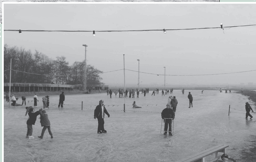
Al gauw kon er op de ijsbaan worden geschaatst.