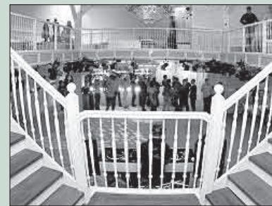
Lexion heropend, pagina 7.