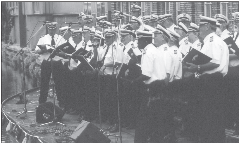
Een buitenoptreden van het Kapiteinskoor.