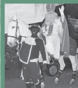
Sinterklaas is weer naar Spanje, de kerstman komt eraan, pagina 11.