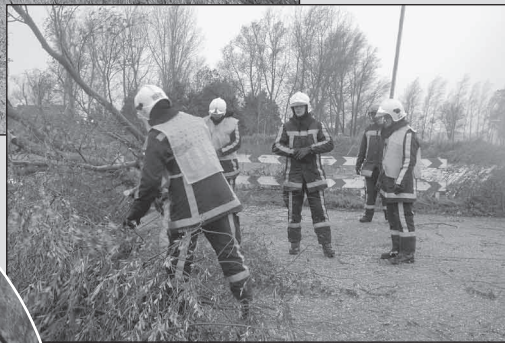
De brandweer kwam handen tekort.