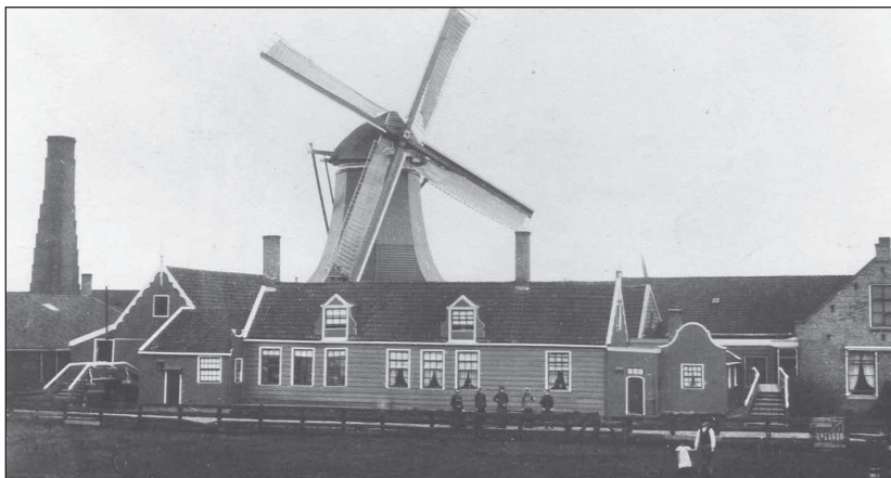
NV Verffabriek Avis omstreeks 1900.

Na ongeveer 100 jaar zullen er weer woningen worden gebouwd op het terrein van de NV Verffabrieken Avis. Voorheen werd hier blauwsel en lakmoes geproduceerd. Later werd de fabricage van bakeliët pers-poeder ter hand genomen, waardoor Avis een der pioniers in Nederland werd van de plastic industrie. Op deze locatie heeft FKG architecten te Zaandijk woningen ontworpen die passen in de karakteristiek van de lintbebouwing. De verkaveling is geënt op het slagenlandschap en de doorzichten vanaf de J.J. Allanstraat maar het weidelandschap.