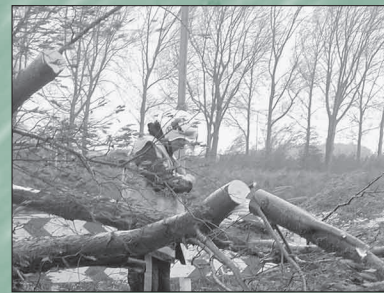
De storm bracht veel ongemak mee, pagina 9.