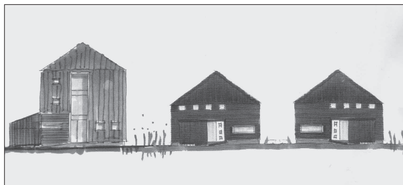
Boven: de woningen aan de J.J. Allanstraat. Onder: de veldgerichte woningen.