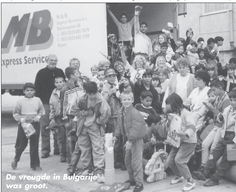
De vreugde in Bulgarije was groot.