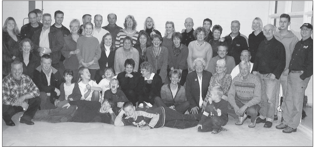
De groep vrijwilligers die zich verdienstelijk maakte voor de actie voor de Bulgaarse kinderen. Mede door deze medewerking werd de jaarprijs van het Geertje Visser-Schoenfonds een feit.