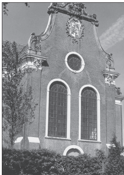
Grote Kerk, hart van Westzaan.