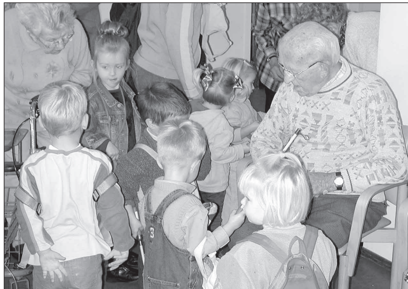
De kinderen van de Peuterspeelzaal liepen Sint Maarten in Lambert Melisz.