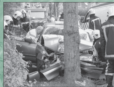
De brandweer heeft vele taken, pagina 9.