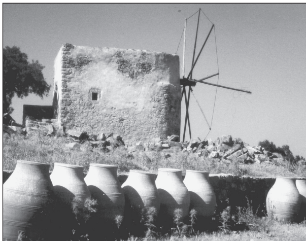
Potten op Krete (foto Jan Hermans).

Voor evenementen van de Stichting Kok-Voogt in de Grote Kerk wordt geen entree geheven. Wel staat er altijd een zogenaamde spreuwenpot voor vrijwillige bij-