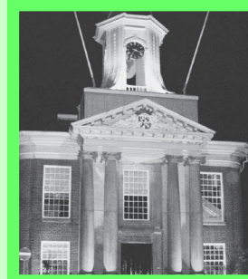
Reght Huys vraagt voortdurend zorg, pagina 2.