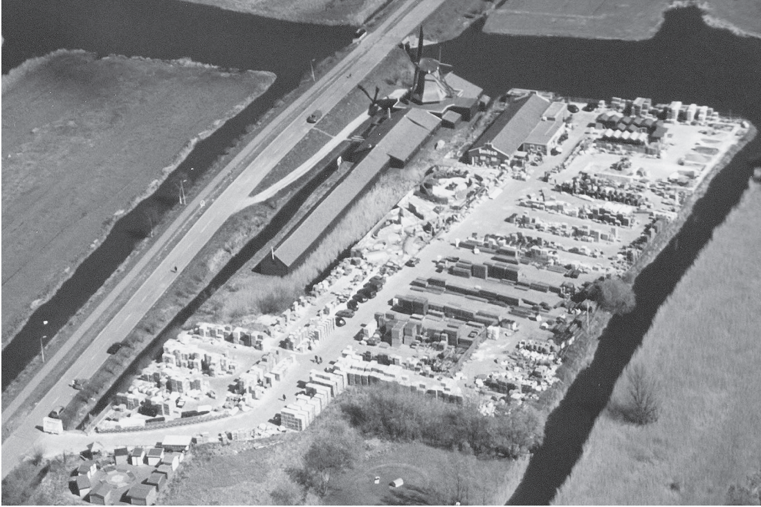
Gezicht op het Guispad en Smitco. Het is weer tijd voor de tuin.