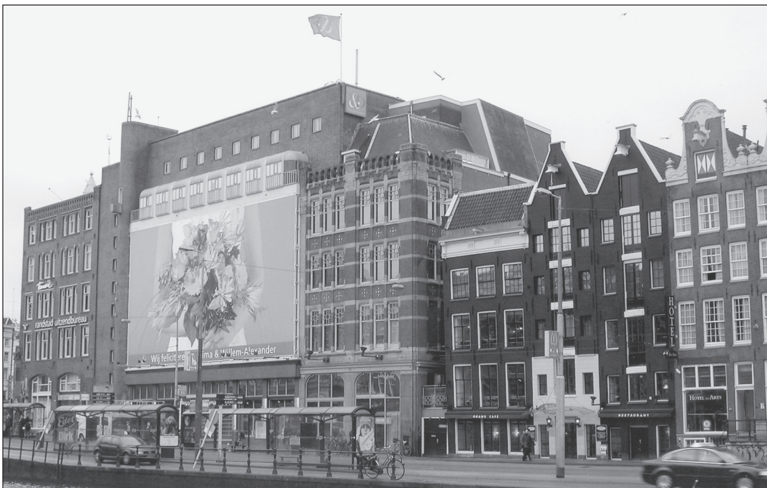
Eén van de projecten van Eydenberg Westzaan: geveldoek 25 x 15 meter bij V&D Amsterdam.