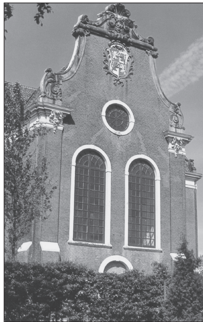
De monumentale kerk is het waard om behouden te blijven.

Voor 2002 luidt het programma: afronden van de orgelrestauratie en voegen van de gevels, het indienen van het restauratieplan voor herstel van de kerkvloer en het op de rails zetten van de financiële zaken voor de eerstkomende jaren, waarbij het financieel afronden van de kaprestauratie (dak en goten). En als belangrijkste item: het blijven zoeken naar sponsors, fondsen en donateurs. Een bord aan de kerkmuur