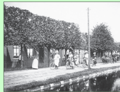
Zo vierde men feest in 1909, pagina 3.