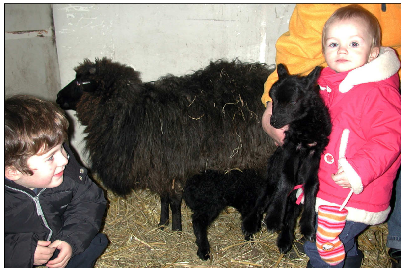
Levende knuffels voor de kinderen Woud.

Op 5 januari stonden wij 's morgens heel verbaasd te kijken toen we de stal binnenkwamen. Totaal onverwacht liepen daar 2 kleine zwarte pluizenbollen. Akke en Aukje waren die nacht geboren. Akke en Aukje zijn geen 'standaard' schapen, maar horen tot het zeldzame ras Skuddeschapen, die oorspronkelijk komen uit het Baltisch gebied, Oost-Pruisen en de Zwitserse Alpen. Maar hier in het Westzaanse veenweidegebied doen ze het prima. Vorig jaar werden er bij ons zelfs twee drielingen geboren, iets wat bij dit ras zeer zeldzaam is. Het aflammeren gaat altijd probleemloos. Mocht u belangstelling hebben voor dit bijzondere schapenras dan kunt u contact met ons opnemen, of kijk op www.skudde.nl