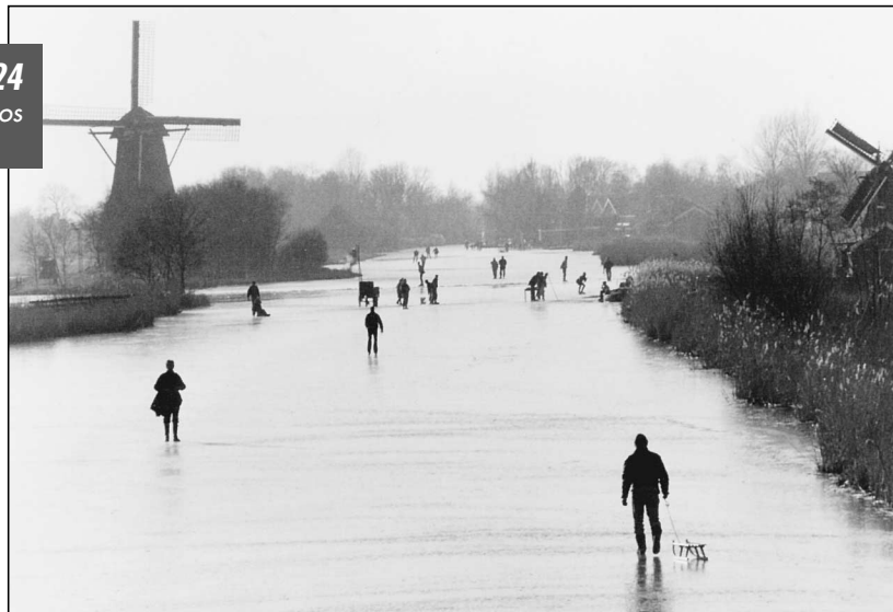
Een echt Hollands plaatje bij molen Het Prinsenhof.

Zou het nog gaan winteren? Terwijl ik deze regels tik, ziet het daar niet echt naar uit. De wind giert om het huis, de thermometer staat op plus zeven graden. Het jaar 2002 heeft nog maar twee ijsdagen gebracht. Wel een heel contrast met de winter van 1929, waarover deze archiefspikkel gaat.