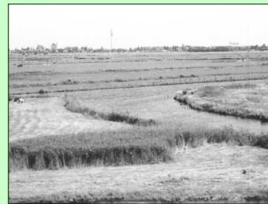
Geen bomen in het Westzijderveld, pagina 7.