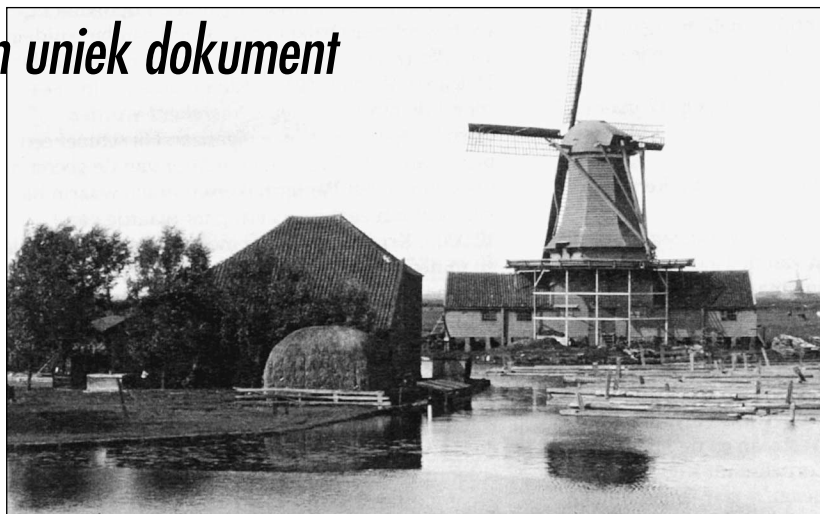
Molen De Tweeling.