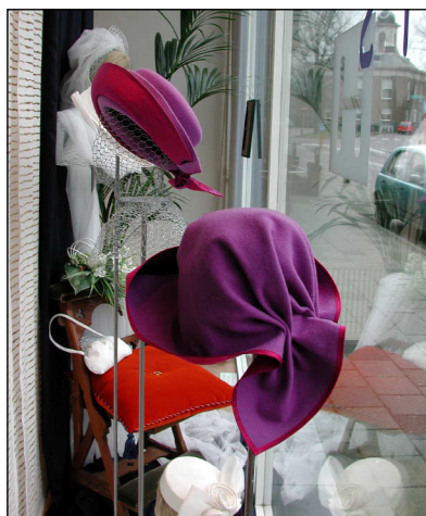
Hoeden bij de kapper.

In het kader van het huwelijk van Willem Alexxander en Máxima bracht HH Kappers in de Kerkbuurt een speciale bruidsetalage met hoeden van Nel Tip-Ouwehand. De etalage trok veel belangstelling. Na haar succesvolle optreden tijdens de monumentendag in de Grote Kerk werd zij overstelpt met telefoontjes. Zij werd uitgenodigd voor een lezing en om een workshop te houden over de wijze waarop met gaas geexposeerd kan worden.