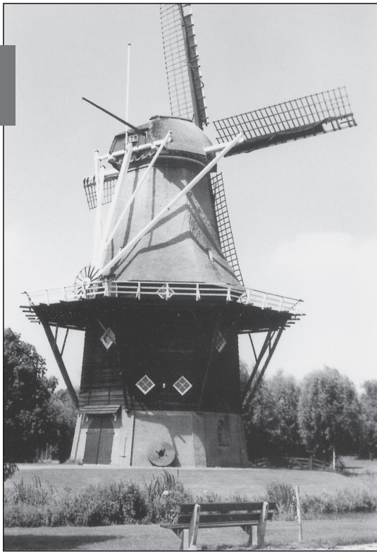
Penninga's Molen, in de Westzaanse geschiedenis bekend als De Jonge Dolfijn.

We keren terug naar De Jonge Dolfijn. Volgens Ron Couwenhoven werd hij al in 1782 (en niet pas ca. 1819, zoals tot nu toe werd aangenomen) omgebouwd tot pelmolen. Eerst werd er alleen gort verwerkt, later ook rijst. In de molen werd rond 1869 ook een doppensteen aange-