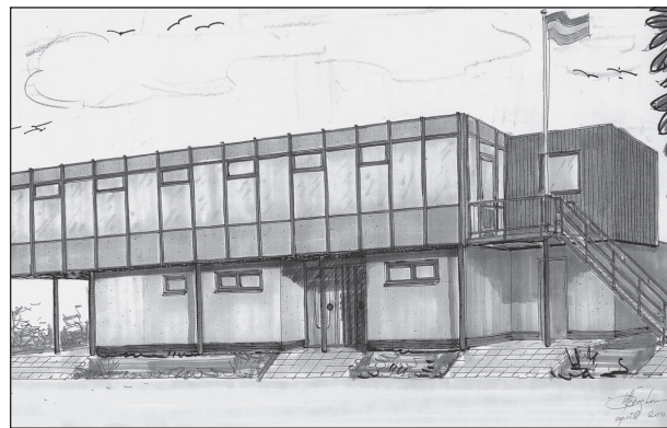
Het nieuwe clubhuis van Roda vanaf de veldzijde gezien.