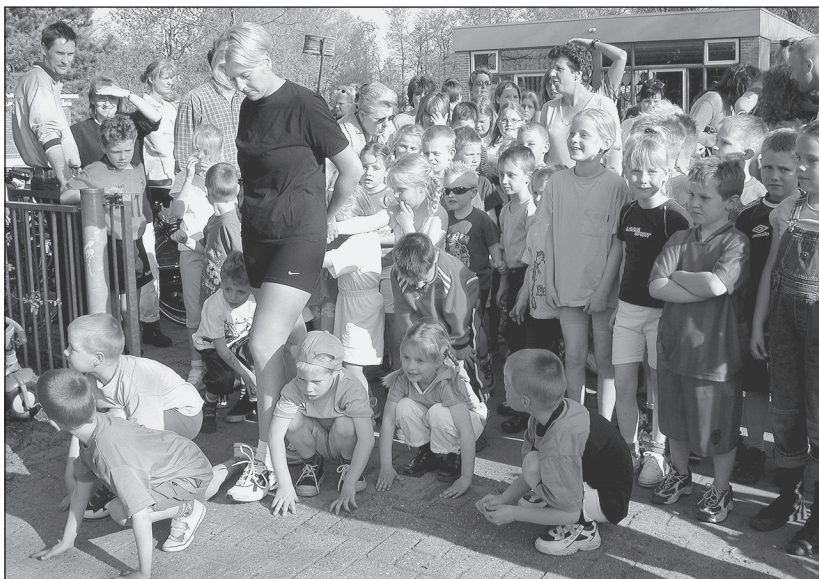
Start van de sponsorloop bij school Kroosduiker-Zuid.

De leerlingen van school De Kroosduiker-Zuid hebben zich weer voor jaren van kampeerprijs verzekerd. Door bijna f 5.000,- bijeen te lopen tijdens hun sponsorloop, is de school in staat om genoeg nieuwe schoolreistenten aan te schaffen om de kampeertraditie in Schoorl voort te zetten. Mede door het prachtige weer en de grote belangstelling was woensdagavond 9 mei een zeer geslaagde avond voor De Kroosduiker.