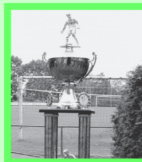
Trofee voor Westzaan junioren, pagina 3.