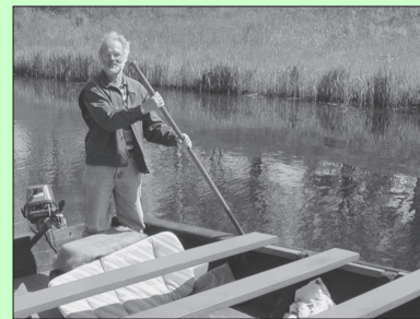
Schipper in het veld, pagina 11.