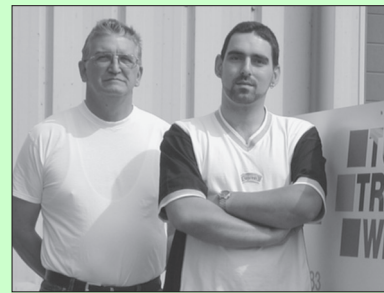
25 Jaar transport, pagina 9.