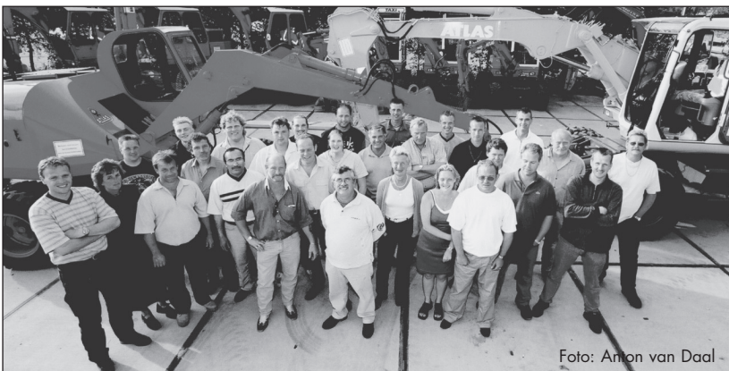
Complete personeel vierde het feest mee.