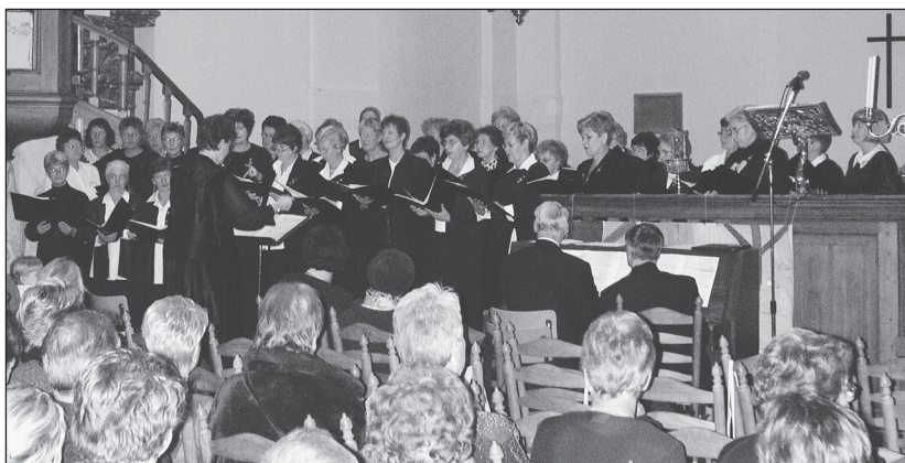
Westzaans Dameskoor in Grote Kerk