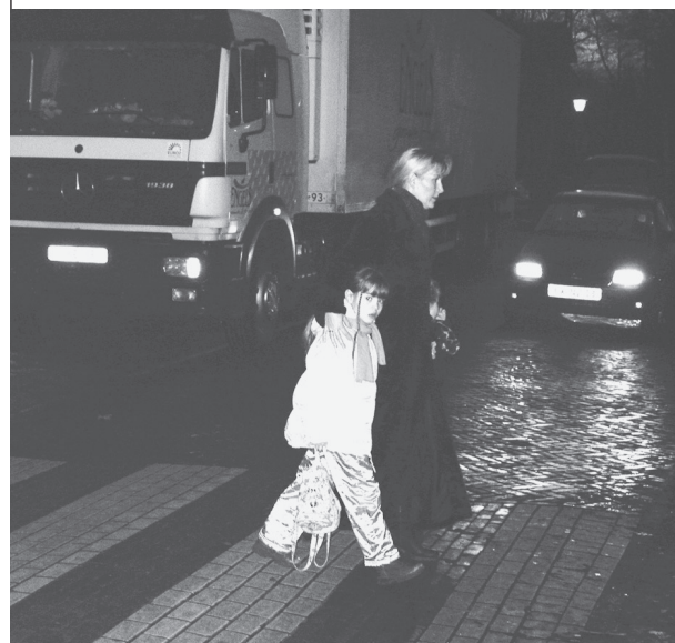
Goed uitkijken is het devies.

Naar aanleiding van het berichtje kwamen er meer reacties los. Een autobezitster, die niet voor de lol de kinderen per auto naar school brengt, vindt dat men in de ouderraad niet moet overdrijven, want het betreft slechts vijftig meter Torenstraat, terwijl in spertijd meer gevaarlijke situaties bestaan voor de kinderen. Als voorbeeld noemde zij de oversteek in de Kerkbuurt, wanneer de grote vrachtauto's bij de Coop lossen en het zebrapad aan het zicht wordt onttrokken.