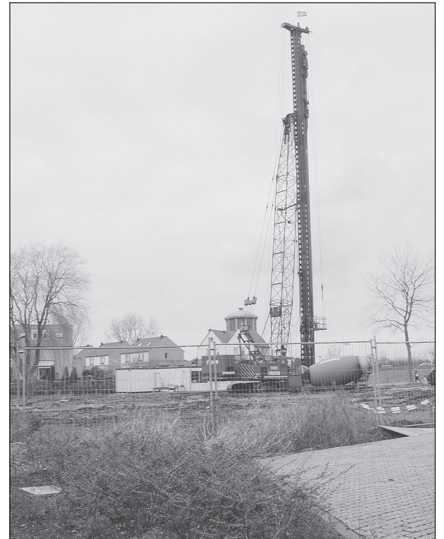
De eerste aanzet voor het nieuwe gedeelte is gegeven.

Op 11 december 1995 werd de eerste paal voor het wooncomplex Lambert Melisz geslagen. Dat ging met het nodige ceremonieel gepaard. De eerste dertig woningen werden 1 januari 1997 betrokken. Inmiddels was men met de renovatie van het nog bestaande gedeelte begonnen, inclusief het wijksteunpunt, dat in maart van het vorig jaar werd geopend. Half december 2000 volgden de voorbereidingen voor de laatste fase. Geen eerste paal ditmaal en dus ook geen officiële ceremonie, daar met een speciale methode werd geheid. Ook deze keer volgen wij maandelijks de voortgang van de bouw.