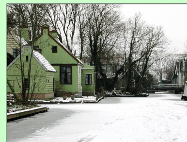
Een winters plaatje aan de Weelsloot.

Westzaan 4.590 inwoners op 1.120 hectare