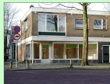
Uitbreiding Rabobank, pagina 17.