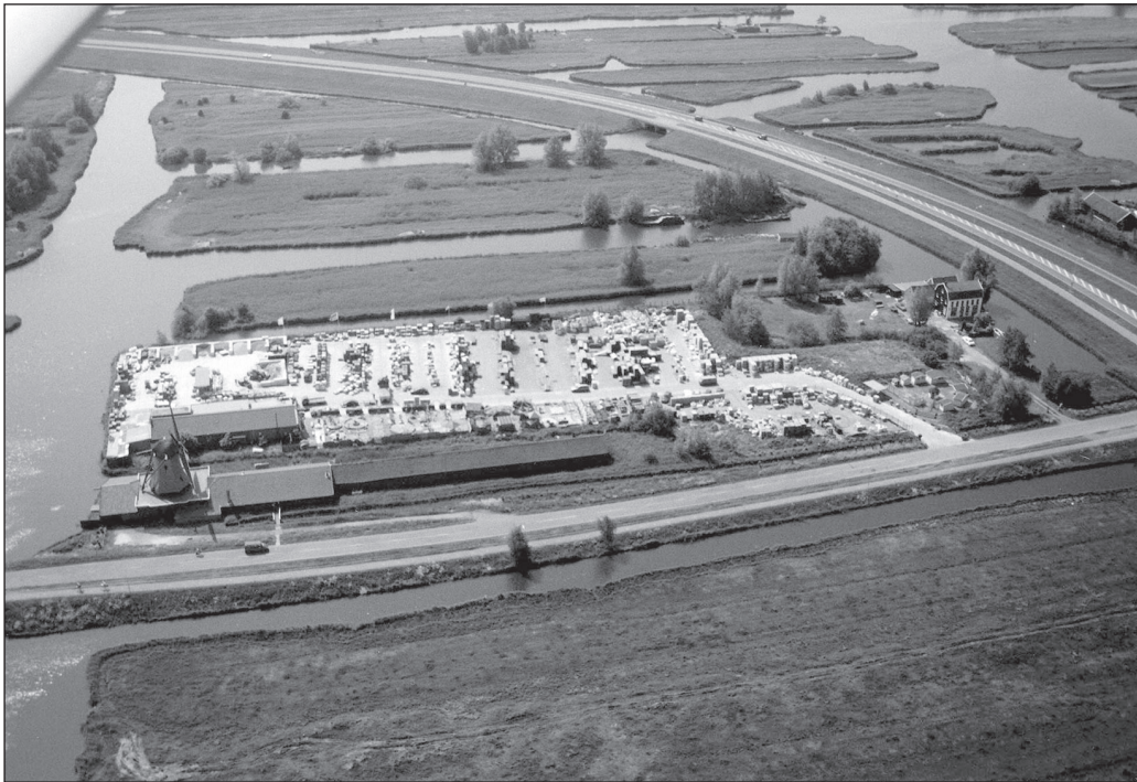
Molen De Schoolmeester en het complex van Smitco ingeklemd tussen de oude en nieuwe Guisweg, de Gouw en de Watering.