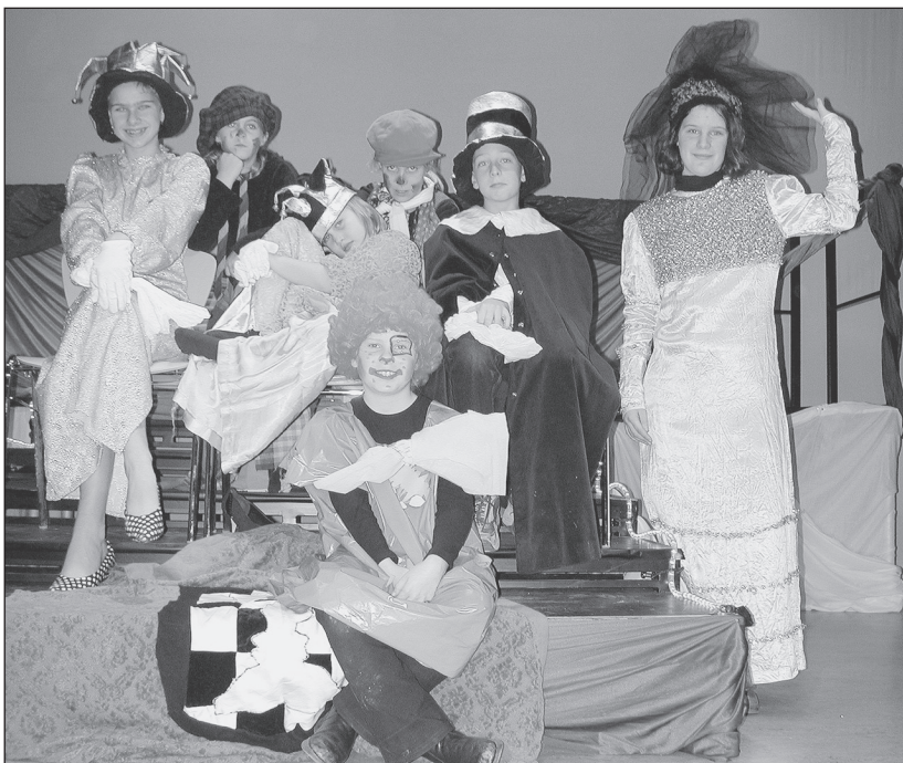
Enthousiast jeugdtheater brengt sterren voor de toekomst.

Op 17 december werd door Stichting Theater in De Kwaker weer een theaterworkshop gegeven. Zo'n veertig kinderen maakten, onder leiding van een enthousiaste ploeg vrijwilligers een voorstelling met 's middags een prachtige uitvoering voor de ouders, opa's en oma's. Vanaf 10.00 uur werd er hard gewerkt aan een zelf verzonden kerstverhaal over een prinses die alles heeft wat haar hartje maar begeert, zelfs speelgoed dat alles uit zichzelf doet. Dan breken er twee zwervertjes in en komt ze voor het eerst van haar leven in contact met leeftijdgenootjes. Het prinsesje gaat met hen mee en leert het 'echte straatleven' kennen. Als ze weer terug moet naar huis wordt ze ziek van verveling. Gelukkig weet de zwerverhoofdman, verkleed als dokter, haar te genezen door haar een dagelijkse kuur buitenspelen voor te schrijven. Voor iedereen was er een rol en al gauw veranderde De Kwaker in een kasteel, waar de hofhouding, het speelgoed en de zwerwers hun best deden om een rol in te studeren. Ook werden er programmaboekjes, posters en toegangsbewijzen gemaakt. De uitvoering was een succes en een hard en welverdiend applaus schalde door de zaal. Na afloop was iedereen het erover eens: de sterren van de toekomst vind je in Westzaan.