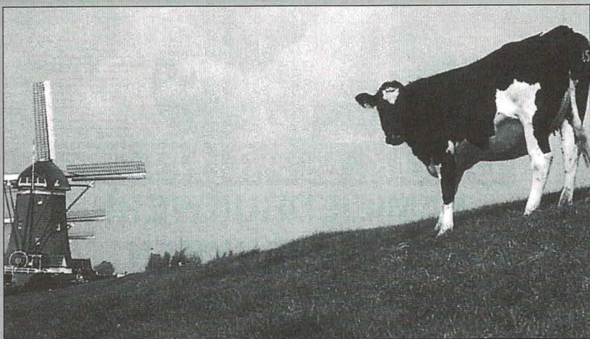
Een echt Hollands tafereeltje.

Dit jaar komt het Fonds met een nieuwe actie. Bij de Rabobank en Lambert Melisz (bij het loket van de Ma-Di) zijn mini-kluisjes geplaatst voor vakantiegangers die na terugkomst van vakantie hun muntgeld kwijt willen. Op de 5 mei te houden braderie van de commissie Volksfeesten aan de Torenstraat staat in de stal van het Fonds ook een kluisje. De actie eindigt pas op 1 januari 2002 wanneer de Euro verschijnt. Dat betekent dat de vaste adressen (Rabobank en Lambert Melisz) zo lang blijven functioneren.