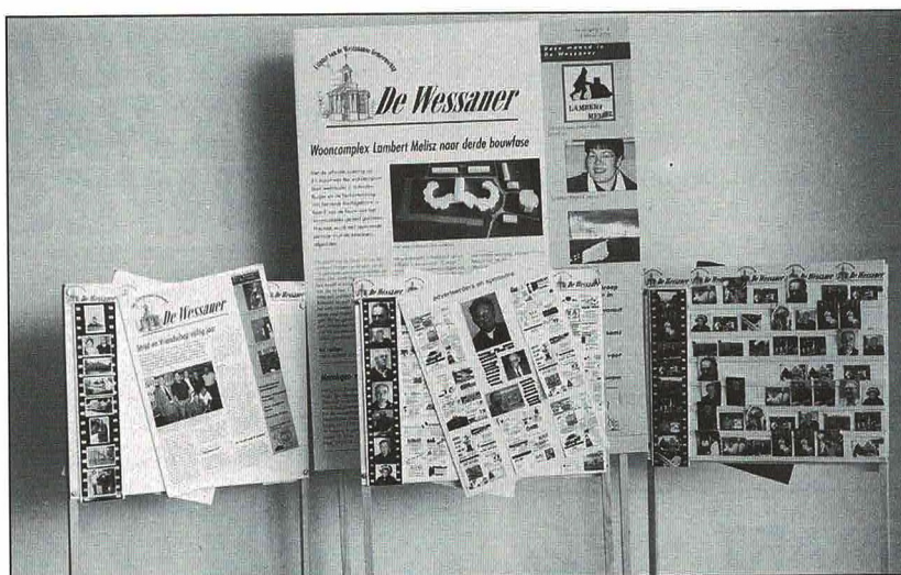
Een voorproefje van de tentoonstelling over De Wessaner.

Met De Wessaner in Beeld heeft de Stichting Kok-Voogt voor de jaarlijks organisatie van het museumweekend een bijzondere tentoonstelling in huis gehaald. De zuiderbeuk van de Grote Kerk wordt geheel bezet door expositie-borden waarop de geschiedenis van 15 jaar De Wessaner is te volgen.