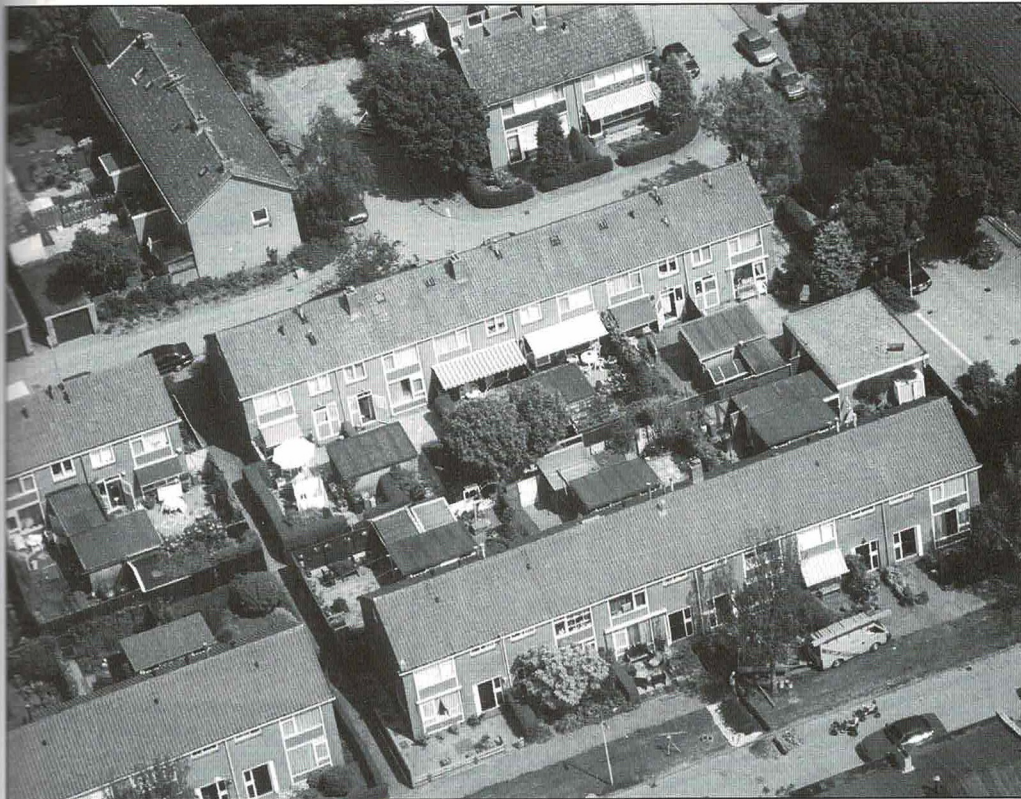
Een deel van de Vogelbuurt.