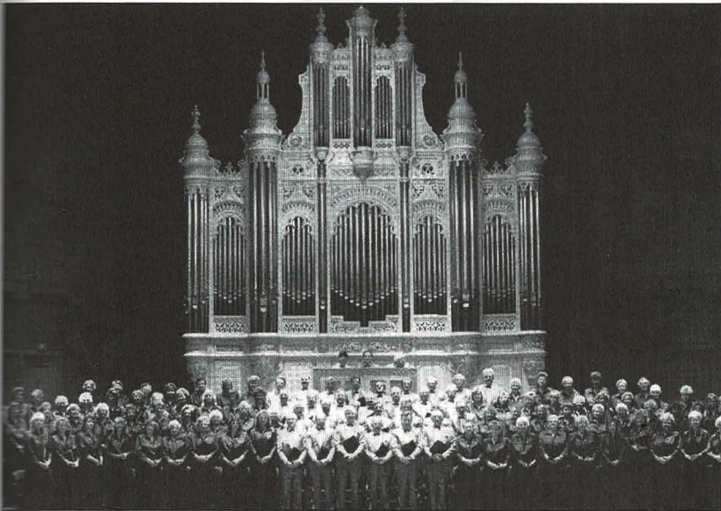
Het imposante kerkkoor Credo.

Op zaterdag 25 maart zal er in de Grote Kerk een grote koor- en samenzangavond worden gehouden. Het is voor de vierde keer dat deze koor- en samenzangavond wordt georganiseerd. De eerste keer was in 1998. Uit de reacties na afloop is gebleken hoe fijn men deze avonden heeft gevonden.