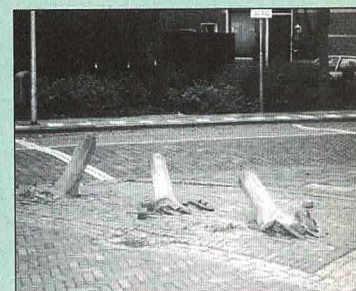
De paaltjes voor het Reght Huys, pagina 3.