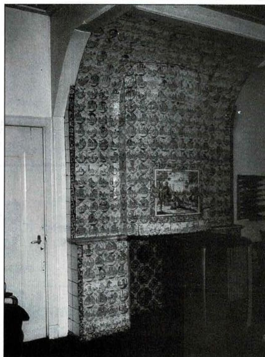
De indrukwekkende smuiger in het kantoor, met het tableau in het midden. De tegels van het tableau zelf zijn blauw, de rest is paars beschilderd.

Over deze schipper en graanhandelaar is teleurstellend weinig in het archief te vinden. Vast staat dat hij tot zijn dood in 1779 eigenaar en bewoner van Kerkbuurt 7 is geweest. Hij behoort dus tot de kandidaten die opdracht gegeven kunnen hebben de smuiger te plaatsen. Omtrent zijn erfenamen en de omvang van zijn nalatenschap heb ik niets kunnen vinden. De uitvoerders van zijn testament brachten in 1780 het pand in veiling. Koper werd burgemeester Poulus de Lange. Hij had er eveneens f 1.700 voor over. Tot zover wat ik heb kunnen vinden over het pand waarin de smuiger ruim 200 jaar het interieur heeft verfraaid.