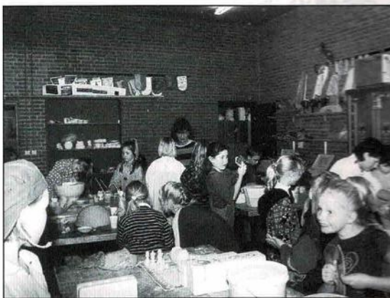
Het volgende doel van de Vrienden; het hobbylokaal.