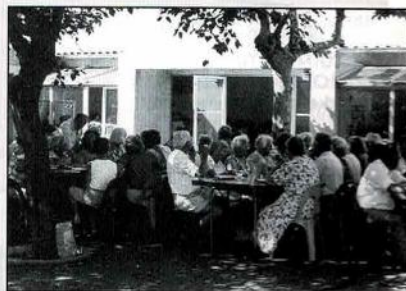
Eerste bezoek aan Sigean in 1991 toen de maaltijden bij voorkeur buiten werden genuttigd.

na het bezoek van de Fransen vorig jaar er zoveel enthousiasme was voor een tegenbezoek. Een handicap is dat onze Franse vrienden aan een bepaalde tijd zijn gebonden. Praktisch alle bewoners zijn bij de wijnbouw betrokken en daarom was de periode vanaf midden april tot 3 of 4 mei aangewezen. Dat schikte Crescendo niet, evenals Drumband De Reef die al eerder afhaakte. Of dit uitstel ook afstel betekent is nog niet duidelijk. Tijdens de eerdere uitwisselingen zijn vele goede contacten geboren en het zou jammer zijn als deze zouden worden verbroken aldus de secretaresse die ook vertelde dat de commissie Bijzondere Activiteiten dezer dagen bijeen is geweest om de situatie te bespreken.