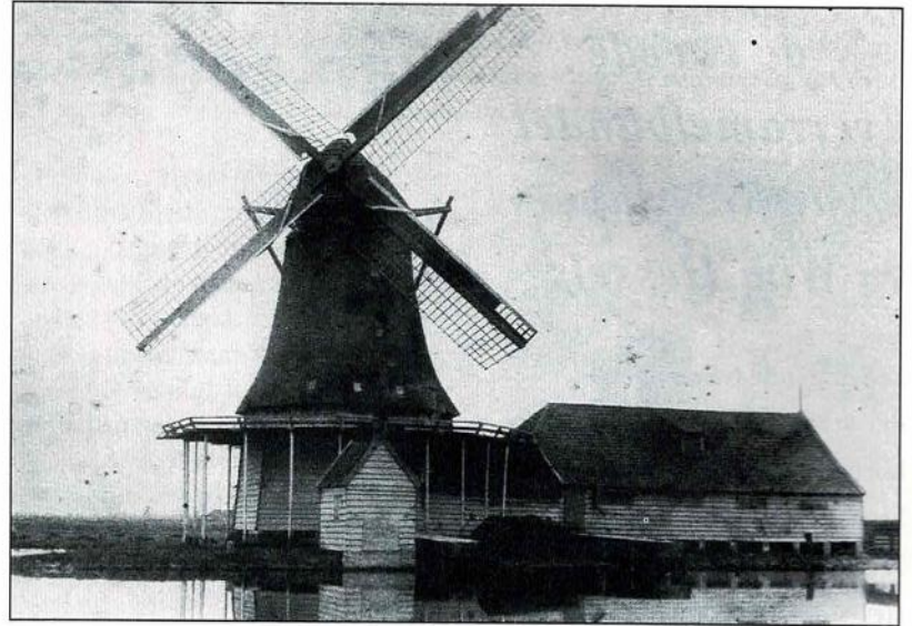
Een foto van Het Prinsenhof ruim 100 jaar geleden toen lijf en schuur nog grijs waren geveerd.