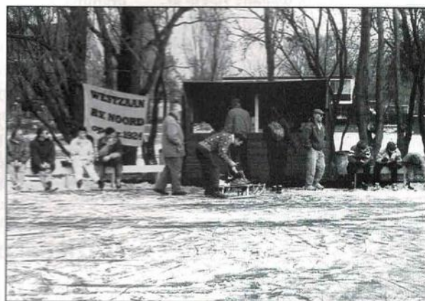
Ijspret zorgt voor gunstige cijfers.