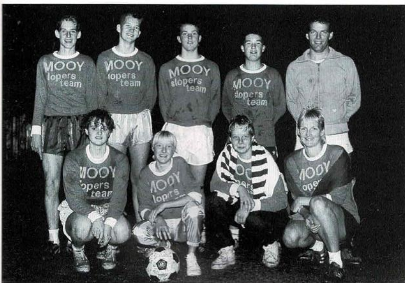
Het achttal van Veldweg/Zuideinde was de laatste winnaar van het stratenkorfbaltoernooi.