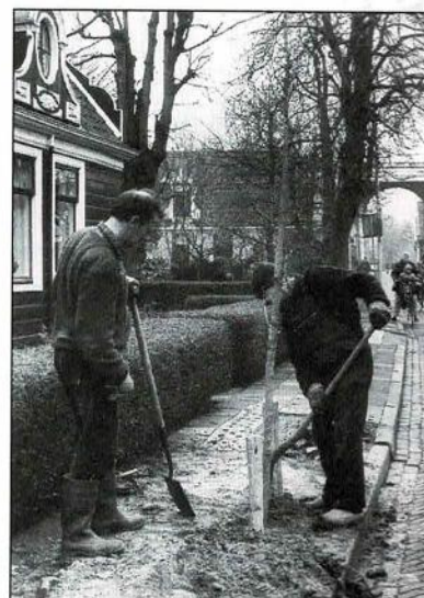
Nieuwe bomen in de Kerkbuurt.

Het geluidsscherm bij de familie Gaal staat er nog steeds. Het besluit dat er iets gedaan moet worden is genomen en het geld ervoor is ook beschikbaar. Nu nog de afwikkeling van de procedure bij de betrokken wethouder. Het eind is in zicht!