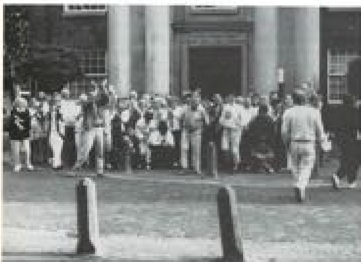
Het vertrek van de Fransen op de ochtend van Helsevrijdag.