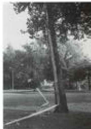
De boom bij de topper van De Schiedamskerkestraat, die de straat moest openen.

Tot zondag 12 juli dachten wij dat tropische regenbuien alleen rond de evensaar voorkwamen. Maar toen binnen het uur 35 mm werd afgetapt veranderde dat beeld. De bui had nogal wat gevolgen, want door verstopte putten stond een deel van de Raadhuisstraat blank en stroomde het water het magazijn van Jb. van Ham binnen. De brandweer moest eraan te pas komen om de schade te herstellen. Tijdens het hevige oewer sloeg de bliksem in bij een woning aan de J.J. Alantstraat en vernielde elektrische apparatuur. Ook enige bomen werden slachtoffer van het natuurgeweld. Overigens een incident, want de zomer koos op dat moment al niet meer strak.