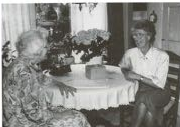
In haren Dekker neemt mevrouw Zaart de instructies in ontvangst.

Dinsdag 16 februari is gereserveerd voor een wissertje door Midden-Nederland met een speciaal bezoek aan landgoed De Treek. Het diner bestaat uit wiet met ruggebrood en kimschapspek. Kosten f 34,50.