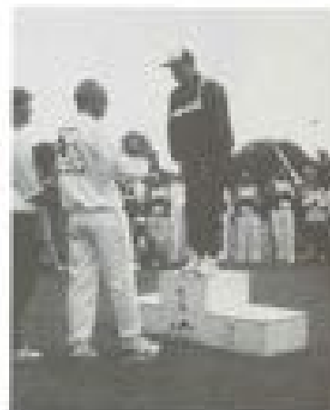
Op de laatste twee en drie van rechts gelachen, loop het plakje naar te storten. En het (legendar) is waar: sport is juist goed voor iedereen die dat kan.

Zou je verder zelf nog iets kwijt willen? Ja. Er zijn mensen hier in het dorp die weten dat ik iets heb, maar wat precies weten ze niet. Dan is het net of ik iets heb of zo. Maar men durft dat niet rechtstreeks aan mij te vragen. Dat vind ik jammer, want ik ben daar heel open in. Ook zie ik, b.v. bij Roda, dat er mensen zijn die mij willen beschermen. Alsof ik de kans