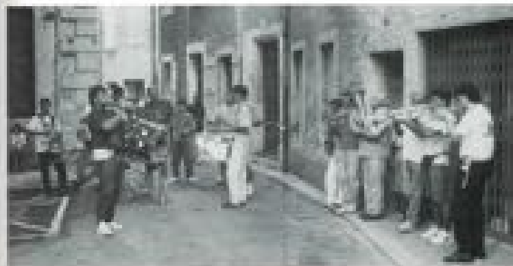
Welkom door het straatkeizer La Florida, dat bestaat bij ons niet van de partij kan zijn.