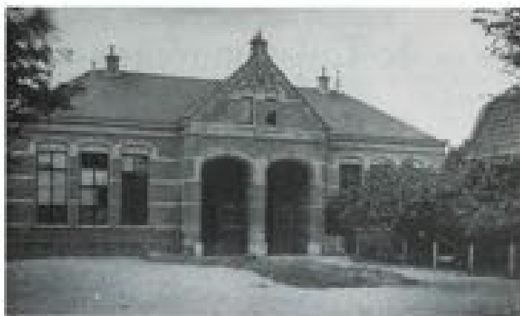
Voorzijde en hoofdingang van de Zuiderschool vóór de verbouw van 1929.

Ten tijde van het overlijden van oude meester Noomen