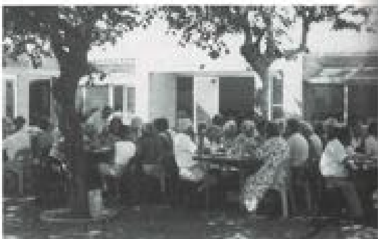
Even in de hooftocht was een fijne gezamenlijke.

zoek vorig jaar september in Sigean en omgeving volop kennis kunnen maken van historische en hedendaagse bijzonderheden. Hierbij een aantal foto's die tijdens deze trip zijn gemaakt.