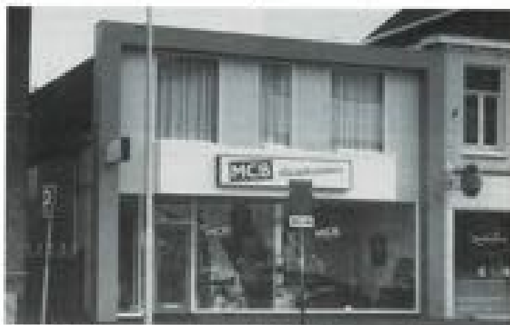
Standaard Centrale Breda (Breda) heeft de uitbreiding nu met de overname van de straat groente en opende daar de nieuwe zaak in slaapkamers en woonwonen artikelen.

bracht. Overtreding van deze verboden kan niet alleen een behoorlijke geldboete opleveren, maar in theorie zelfs een gevangenisstraf van een jaar. Ook kan het vernielen of anderszins beschadigen 'met behulp van de sterke arm' (van de politie) worden belet. Daarnaast kunnen burgemeester en wethouders het beschadigde monument op kosten van de vernielers terugbrengen in zijn vroegere staat.