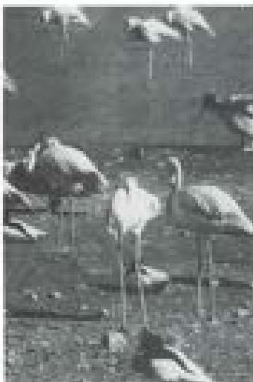
Een deel van de landbouwproductie die we konden bekijken.