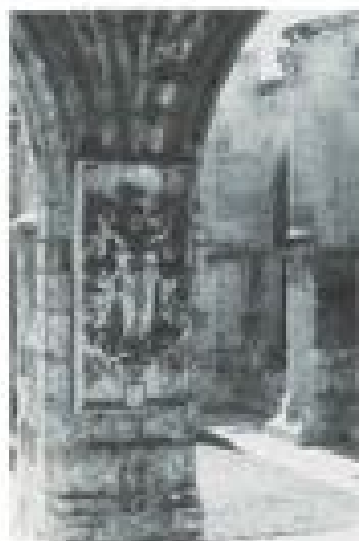
Franse ruïnes die hun verhaal vertellen over de eeuwen zo rijk