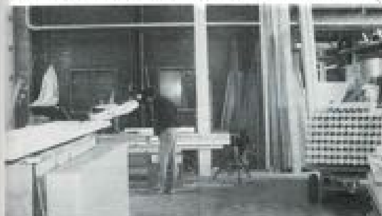
Eydenberg Hout in vol bedrijf.

Bij de Kerk van de Nazarener in Koog voel ik mij het meeste thuis. De blijdschap en vreugde van die mensen spreekt mij aan. Maar om nu te zeggen dat ik een Nazarener ben, of gereformeerd of wat dan ook, nee. Ik probeer in de eerste plaats een christen te zijn. En ik hoop dat ik mijn blijdschap uitdraag. En dat geldt zowel voor mijn werk als voor mijn omgeving.