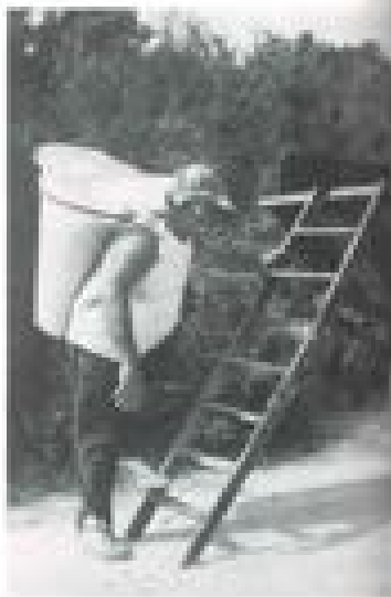
Een draaiwielwerker gaat met vrucht te werken.