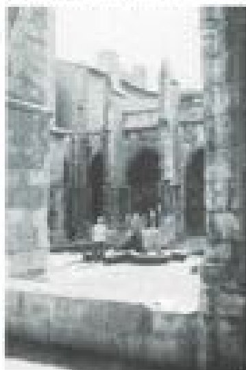
geschiedenis van dit deel van Frankrijk.