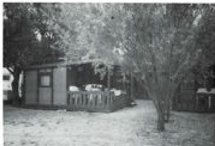
Deindruk naar de Westzaaners in Sigean