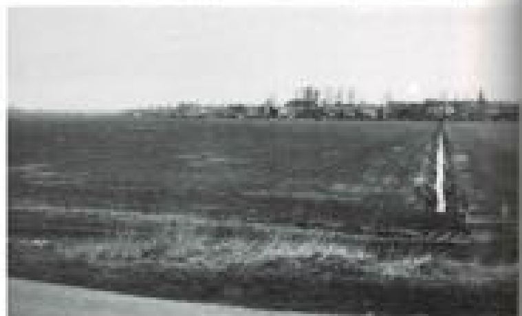
Kijkt op de Westraanse polder met zicht op de Veldweg. Net als het plan is ook het beeld mistig.

In dit dagelijks bestuur hebben zitting vertegenwoordigers van de subregio's Zaanstreek, In-