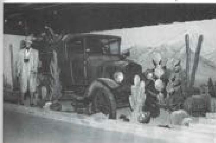
Op de expositie zijn veel voorwerpen in natuurlijke omgeving tentoongesteld. Hier een motorwagen uit de Eerste Wereldoorlog in de oerwacht (France Ford auto) (1914).

rijg oldtimers. Hiervan kwamen de meeste als wrak binnen, maar staan nu als nieuw te pronk. Het bleef echter niet alleen bij verzamelen van oude auto's en motoren, want Jaap is gek op alles wat oud is. Arrisloeren, vliegende Hollanders, kassen, kinder- en popperwagens en jukeboxes, allemaal exclusieve artikelen die tussen de bloemen en planten een plaatsje vinden.