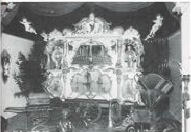
Een mooi plaatsje in de Valkhal is ingericht voor het in 1888 gebouwde maatslot De Twee Oranjes. In 1885 werd het orgel geheel gereconstrueerd en het is nu het pronkstuk van de prachtige collectie.