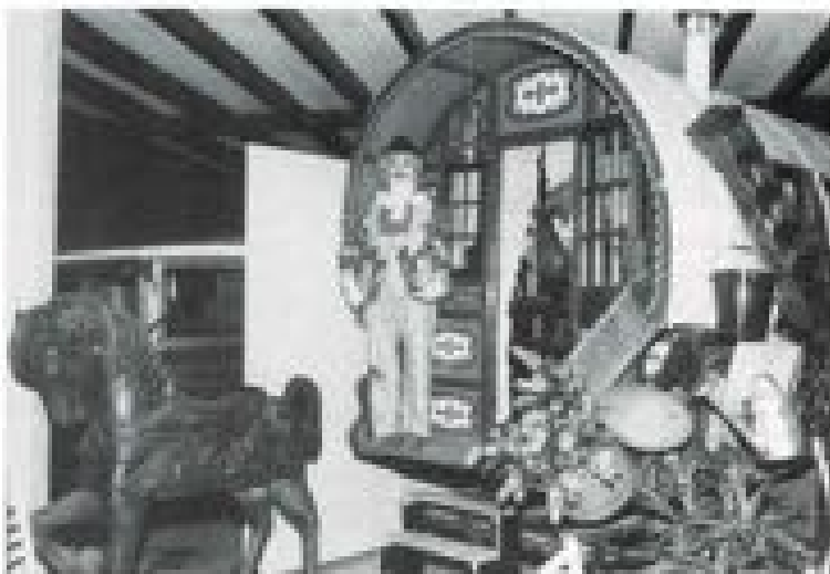
De legendarische Pipr de vloer voor zijn in originele staat opgepluigde motorwagen.

Onze plaatsgenoot wil graag veel bezoekers laten meegenieten van zijn collectie, maar er zijn natuurlijk grenzen. In de eerste plaats is de opzet bedoeld als PR voor de vele Duitse klanten. Dit ook in combinatie met De Oude Herbergh en volgens afspraak. Om een ieder te laten genieten van de unieke verzameling is de Valkhal iedere zaterdag geopend.