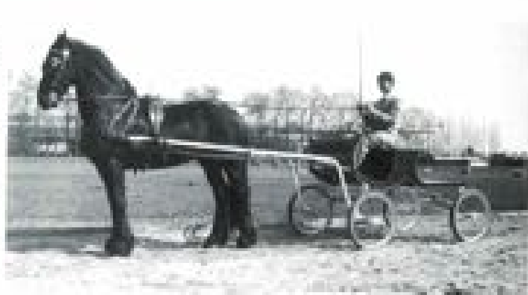
Dirk en Wanny

Met tussenpozen heeft hij bij verschillende manege's les gehad en werd een goede recreatieve ruiter. In 1986 kocht hij een eigen paard, een Gelderse bruine. In de manege waar hij zijn paard stalde, stond ook een echte volbloed Fries, Wanny genaamd. En op dat