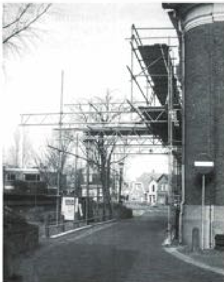
De werkzaamheden aan het Reght Huys vertonen in de tweede fase, vandaar de senger aan de westkant van het gebouw.