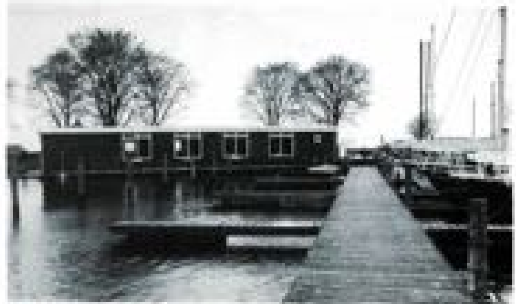
De jachthaven is worden met aan de achterzijde het fraaie kantoorgebouw.

Op zaterdag 25 mei, de landelijke dag voor watersportrecreatie, gaat er voor de Watersportvereniging Bruynzeel een nieuwe wereld open. Op die dag opent de vereniging op de plaats van het vroegere zwembad in het zijkanaal haar nieuwe jachthaven en dat gaat met de nodige festiviteiten gepaard.