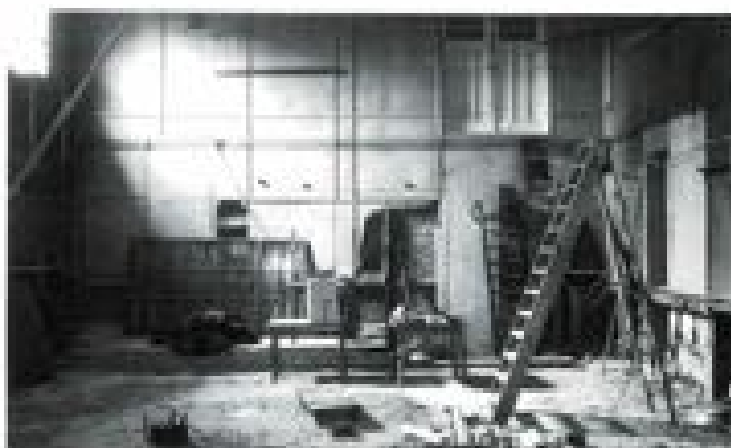
Onder het toneel van De Prins lagen de resten van wat eens de kolfbaan was.

Aanvankelijk lagen de banen in de openlucht en waren met schelpen bestrooid. Dat er schelpen onder het toneel van De Prins zijn gevonden, duidt erop dat ook hier de baan wellicht eerder buiten heeft gele-