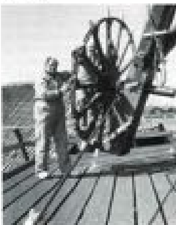
Piet Klees en Aad Schoen werken volgens ouderwoud recept

J.J. Allanstraat 127. Op 13 mei is er één extra rondvaart. Het is de z.g. hulaaktocht, die start om 7.00 uur. De toer duurt ongeveer 1½ uur en de kosten bedragen f 5,- per persoon en f 4,- voor kinderen tot en met 12 jaar. Vooraf reserveren is gewenst en dat kan bij de Zaanse VVV, Gedempte Gracht 76, Zaandam, telefoon 075 - 183221 of 351747.