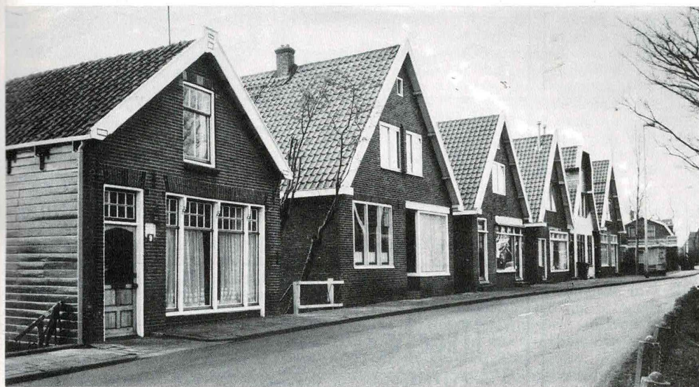
De Overtoom..... eens een drukke winkeldijk

van de winkelstand en dat de grens is bereikt. Het is een algemeen verschijnsel en ook in Den Haag ging een aantal ogen open. Men stelde een subsidie-regeling in voor buurtwinkels in dorpskernen, maar hieraan zitten nogal wat haken en ogen, zodat het zeer twijfelachtig is of ons zuidelijk dorpsdeel hiervoor in aanmerking kan komen. Wel leert de ervaring dat als men op dit punt wat wil bereiken de initiatieven uit de bevolking zelf moeten komen, want een gemeentebestuur vindt het vaak gemakkelijker om op dit punt maar niets te doen.