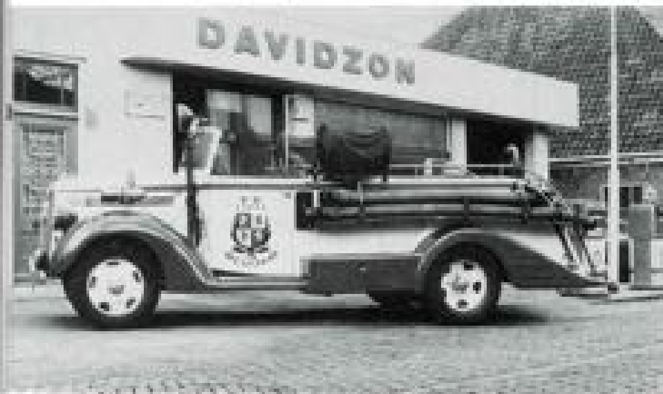
vaste deelnemers aan het Old-Timersfestival

Eize honderd leden van de scholen-gemeenschap Westzaans in Beverwijk zullen op donderdag 4 juli een bezoek brengen aan Westzaan, waarbij een wandeling wordt gemaakt langs de bekende historische route en ook de scholen des Prinsentof wordt aangedaan. Na de oproep voor gidsen van de historische vereniging hebben zich acht aspirant-gegidsen aangemeld.