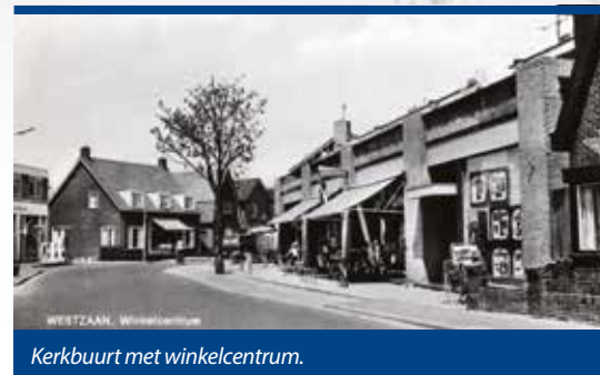
Kerkbuurt met winkelcentrum.

Veel verdergaande vernieuwingen werden echter vastgelegd in een gemeentelijk bestemmingsplan uit 1968. De moderne bank- en winkelpanden waren alleen maar een eerste aanzet geweest. Een nieuwe rij van acht winkelpanden zou aan de overkant van de straat het Westzaanse winkelcentrum vervolmaken. Verder werd gedacht aan een aanzienlijke verbreding van de dorpsstraat. Het verkeer moest de ruimte krijgen. De historische houtbouw langs de Kerkbuurt en de J.J. Allanstraat moest daarbij plaats maken voor eigentijdse nieuwbouw. Westzaan zou de komende tien jaar op een moderne manier de industrialisatie tegemoet treden. Van het hele moderniseringsplan zou uiteindelijk vrijwel niets worden uitgevoerd. De tijd zou het leren.