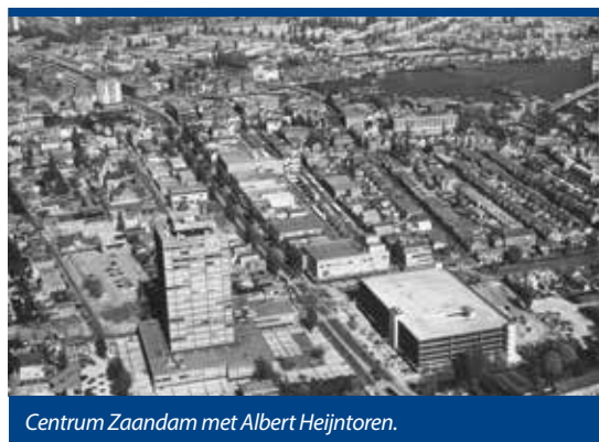
Centrum Zaandam met Albert Heijntoren.

Gelijktijdig met de verkeersdoorbraken moderniseerde Zaandam haar centrum. Aan weerszijden van de Gedempte Gracht verschenen de strakke gevels van de landelijke winkelketens. Aan het eind verrees als merkteken een veertig meter hoge kantoor-toren, bekleed met aluminium platen (1971). Ertegenover kwam een ruime parkeergarage. Over de drukke Provincialeweg leidde tenslotte een winkeltraverse naar het station (1983). Een afspiegeling op bescheiden schaal van het Utrechtse Hoog Catharijne. Dat massale stelsel van betonnen gebouwen ontstond in dezelfde tijd (Van der Male, 2019, p 96-101).