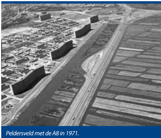
Peldersveld met de A8 in 1971.

Toch was het succes van de modernisering maar matig. De nieuwe winkelstraat bleek te breed, te druk, te lawaaiig, te winderig en vooral te ongezellig. Nog sterker gold dat voor de winkelgalerijen onder de flats aan de oostkant van de Zaan. De modernistische start werd een beginpunt van veel verbeterpogingen. Op een zeker moment verschenen er zelfs grote paviljoens midden op straat.