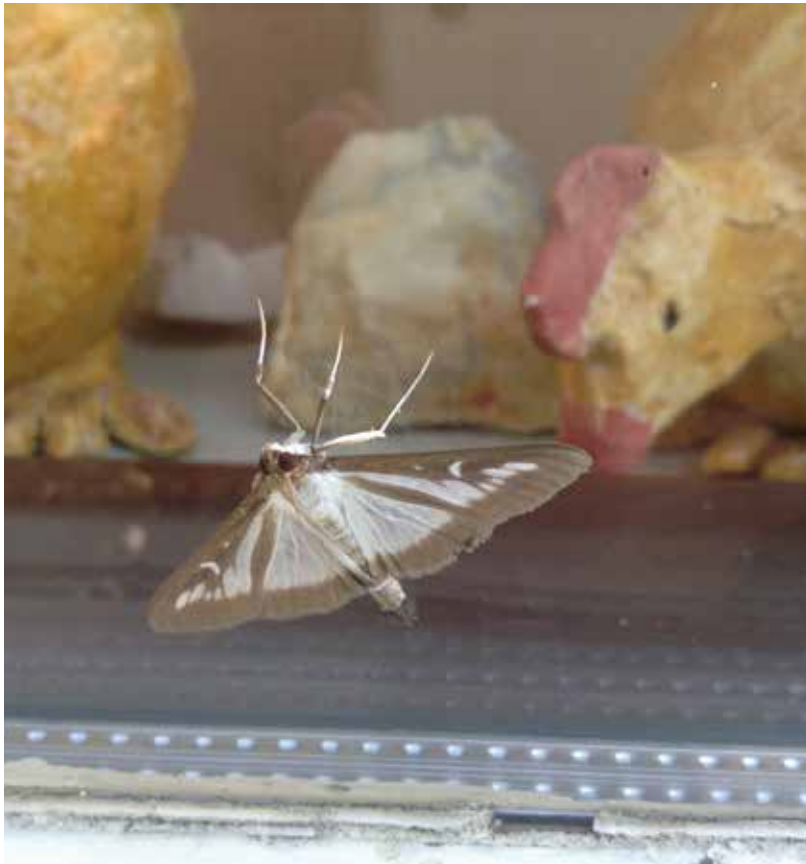
De buxusmot.

De buxus is de ideale plant voor lage heggen, bijvoorbeeld als afscheiding langs paden of wegen, en ook zeer geschikt voor vormsnoei. De buxus is een langzaam groeiende plant, die goed tegen schaduw kan, groen blijft in de winter en op de meeste bodemtypen prima overleeft. Hij kan wel vijf meter hoog worden, als je hem de vrije loop laat. Maar hij kan echter slecht tegen te natte omstandigheden en erg veel wind is ook niet ideaal. Sinds een paar jaar worden veel buxusplanten bovendien aangetast door de rupsen van de buxusmot.