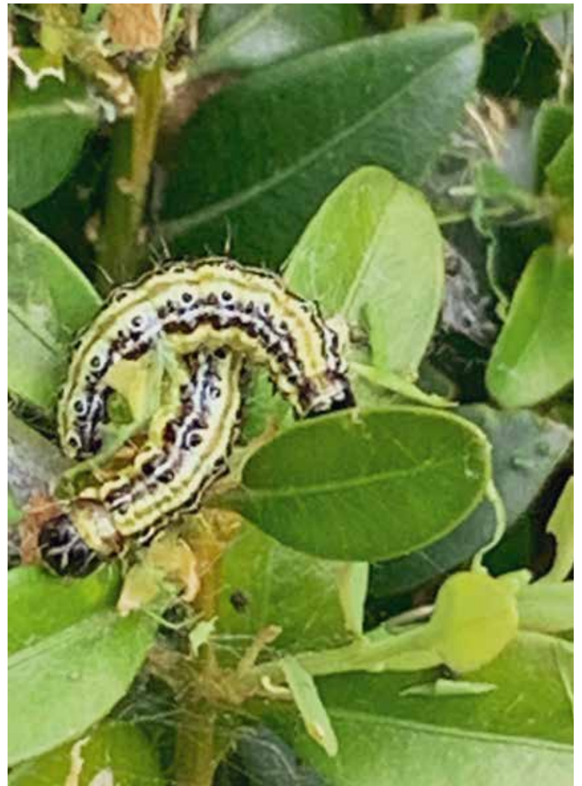
De rupsen zijn veelvraten.

Nu maar hopen dat de vogels massaal op onze buxusstruiken gaan zitten om van de rupsen te smullen. Er is nog hoop voor de buxus!