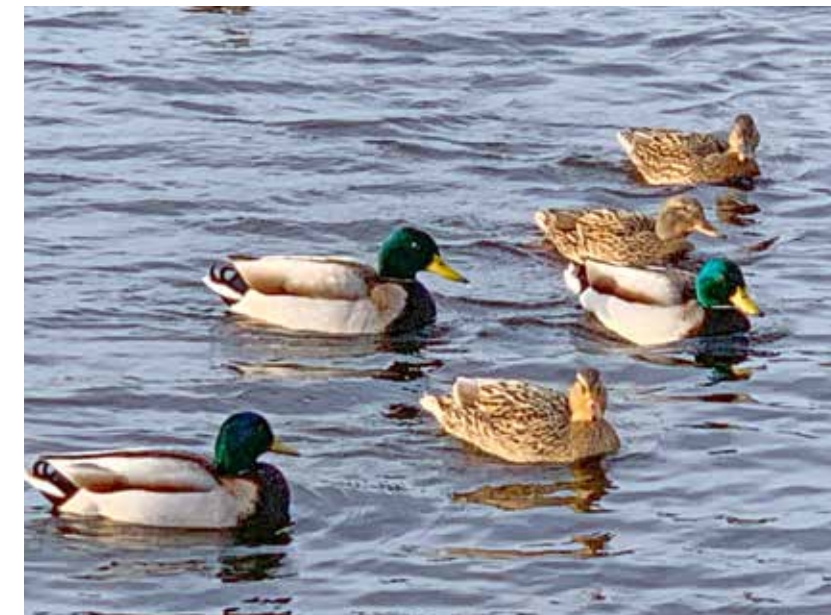
Wilde eenden bij Het Prinsenhofstraat.

Bij sommige lezers zullen de wenkbrauwen misschien wel omhooggaan als ik het heb over zo'n 'doodgewone' eend. De wilde eend ( Anas platyrhynchos ) is zo gewoon, dat we nauwelijks in de gaten hebben dat er de laatste decennia steeds minder van zijn. Sinds 1990 is volgens SOVON ongeveer 30 procent van de broedpopu-