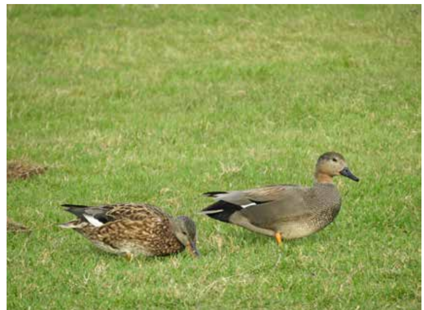
Rechts het mannetje.

ven hier over het algemeen ook in de winter. Tenzij het streng gaat vriezen, dan trekken zij door naar Zuidwest-Europa. Het nest wordt op de grond gebouwd tussen de dichte oevervegetatie en is goed verscholen. De acht tot twaalf crèmekleurige eieren worden door het vrouwtje in circa 24 dagen uitgebroed. Het mannetje is dan meestal al vertrokken. De jongen verlaten direct het nest (nestvlinders) en kunnen dan al zelf foerageren, waarbij zij nog wel enigszins beschermd worden door het vrouwtje.