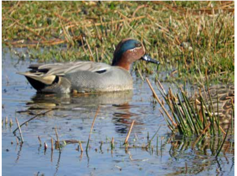
Wintertalingmannetje in de Kalverpolder.

Het mannetje (zie plaatje) heeft een opvallende, horizontale witte band op de schouders. Hij heeft een kastanjebruine kop met een brede groene oogvlek, doorlopend tot op het achterhoofd. En een roomgele vlek aan weerszijden van de zwarte onderstaart. De snavel is grijs, de poten zijn bruingrijs. Het vrouwtje heeft gevlekte bruine bovendelen en flanken. De kruin is donkerder, de onderdelen zijn 's zomers gevlekt en 's winters witter. Beide seksen heb-