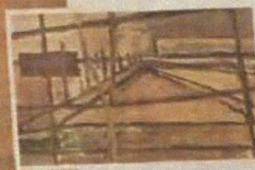
Jaap Kaal, Stuuie in abstractie, 1906.