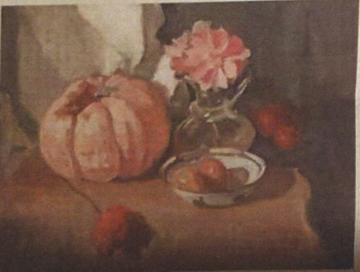
Jaap Kaal, Stillleven met glazen, 1918.