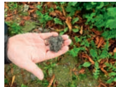
Uilenbal met muizenbotjes.

Volgens SOVON broedden er in 2007 in Nederland nog ongeveer 5500 paren. Het aantal broedparen is in de periode 1990-2007 met meer dan 5 procent per jaar achteruitgegaan. Als voornaamste oorzaak van de achteruitgang wordt het talrijker worden van de havik gezien, maar ook de vergrassing, waardoor muizen lastiger te vangen zijn. Ook de achteruitgang van het aanbod aan lege kraai- en eksternesten is van invloed. De ransuil staat op de internationale Rode