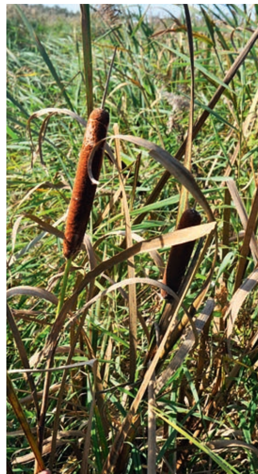
De kleine lisdodde ( Typha angustifolia ).

Wat nu? Het onderhoud dreigt volgens deskundigen onbetaalbaar te worden. De Nauernasche Vaardijk kun je niet blijven ophogen. De bodem klinkt steeds sneller in. Kunnen we het gebruik van 'nieuwe' gewassen zoals lisdodde en cranberry stimuleren? Hier liggen volgens Landschap Noord-Holland kansen om het mooie, natte landschap waarin we in Westzaan leven duurzaam te behouden.