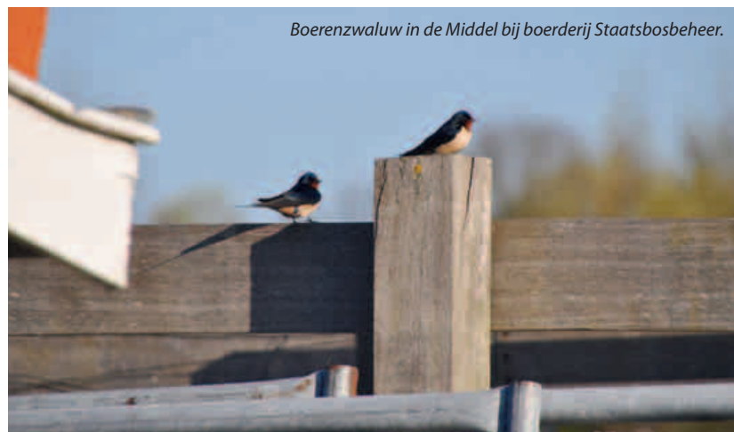
Boerenzwaluw in de Middel bij boerderij Staatsbosbeheer.

ringsgebieden te trekken (zie kaartje). Boerenzwaluwen die de barre tocht van 9000 kilometer heen en weer terug hebben overleefd, keren op dezelfde broedplaats terug. De boerenzwaluw heeft als meest opvallend kenmerk de lange, diep gevorkte staart. Hij of zij is gemakkelijk te herkennen aan het diep donkere verenpak met metaalblauwe gloed. Ook zijn roodbruine keel en voorhoofd en roomwitte buik zijn kenmerkend.