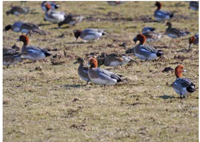
Een groep smienten.

De smient is een echte wintergast die van harte welkom is. Ja toch? Een eend om trots op te zijn.