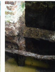
De houten fundering (foto rechts) waar de poeren op staan is verrot.