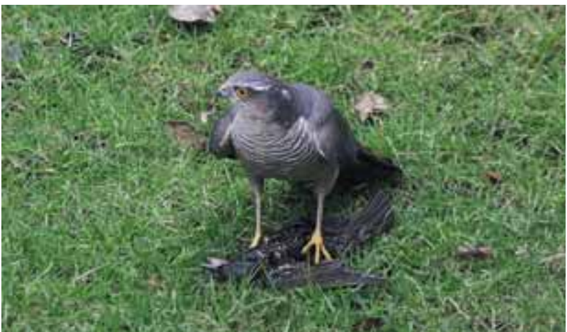
Sperwermannetje met gevangen spreeuw.

gronden. In laagveengebieden in West-Nederland was deze relatief kleine roofvogel een zeldzaamheid. Daarna volgde gelukkig een geleidelijk herstel. In de oorspronkelijke broedgebieden nam het aantal toe en er volgde een uitbreiding van het broedareal naar de laaggelegen gebieden in Nederland zoals Westzaan. In Nederland broedt de sperwer nu zelfs al in alle grote steden. Het aantal sperwers is waarschijnlijk nog nooit zo groot geweest als in 2000, toen het SOVON 4000 tot 5000 paren registreerde.