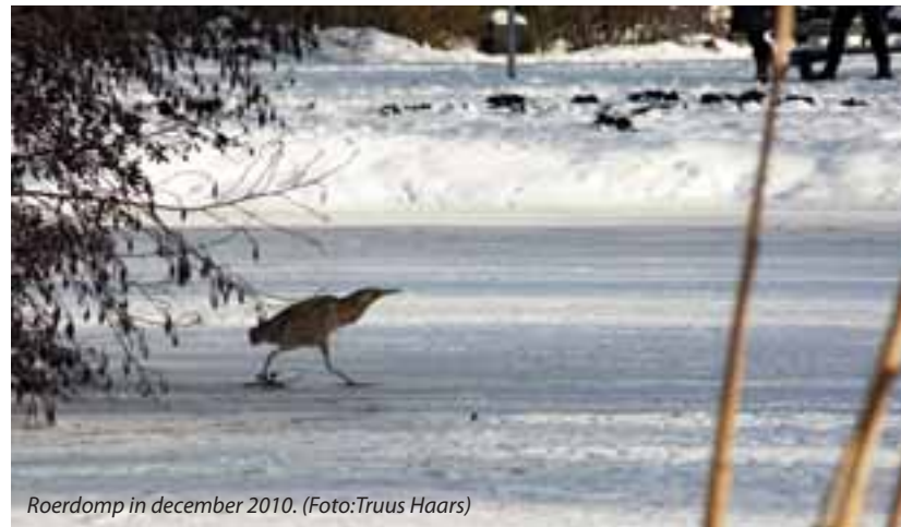
Roerdomp in december 2010.

het helaas wat stiller geworden. Vermesting en verdroging eisten hun tol. Gelukkig veren de aantallen broedvogels de laatste 25 jaar weer wat op, mede dankzij het zachte winterweer van de afgelopen jaren, natuurontwikkelingsprojecten, een hogere waterstand en aangepast maaibeheer door Staatsbosbeheer. Ik verwacht dan ook dat het aantal roerdampen in de nabije toekomst zal stijgen. Een geruststellende gedachte.