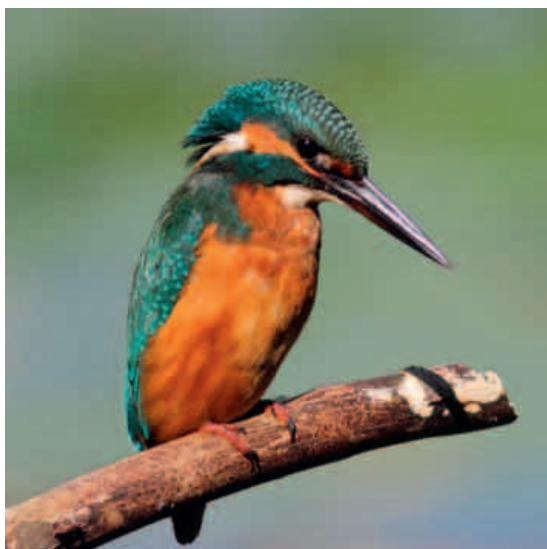
Ijsvogel zittend op een tak, mannetje.

Na de bijzonder strenge winter van 1962/1963 werden nauwelijks nog 25 broedende paren waargenomen. In de Natuuratlas van Zaanstad staat vermeld dat na een lange vorstperiode gemiddeld de helft van de vogels het loodje legt. Er is dan gewoonweg geen geschikt viswater te vinden. De ijsvogel kan slecht tegen koude en een zeer strenge winter is vaak fataal. Sommige verongelukken trouwens doordat ze bij een duik een harde klap op het ijs maken.